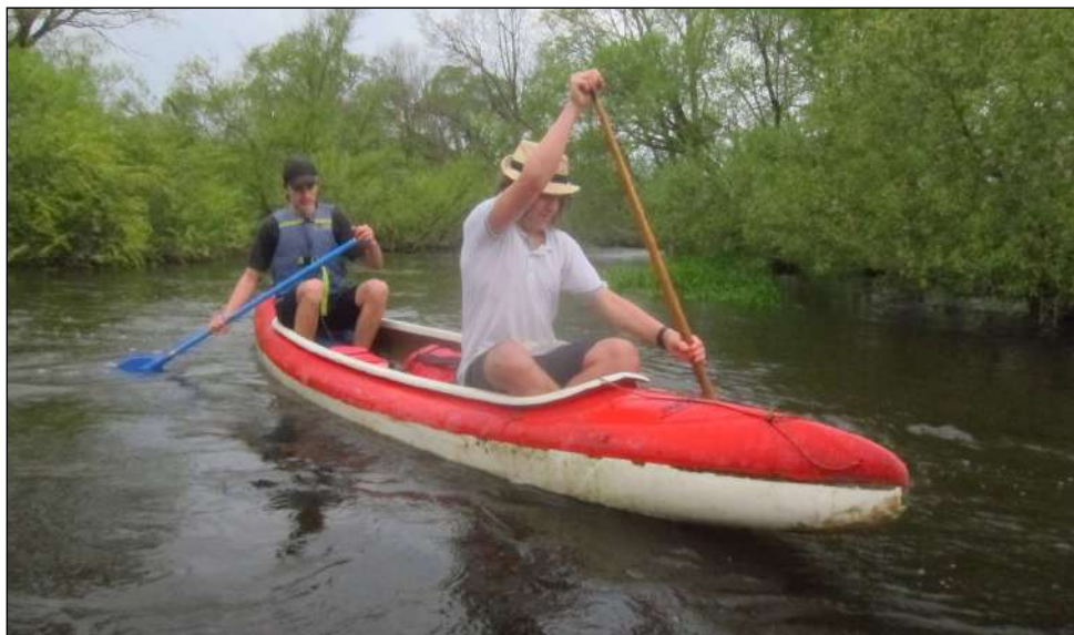
Už a Api

hezky schované (které byly samozřejmě o cca 40 Kč/kg levnější). S těstovinami se pak opakovalo něco podobného. Tím jsme se ale nenechali zmást a nakoupili vždy to výhodnější. Jinak vše proběhlo dobře, paní pokladní z nás sice asi byla trochu nešťastná, ale my jsme byli s jednou hodinou času, 4500 Kč a 50 kg jídla docela spokojeni.