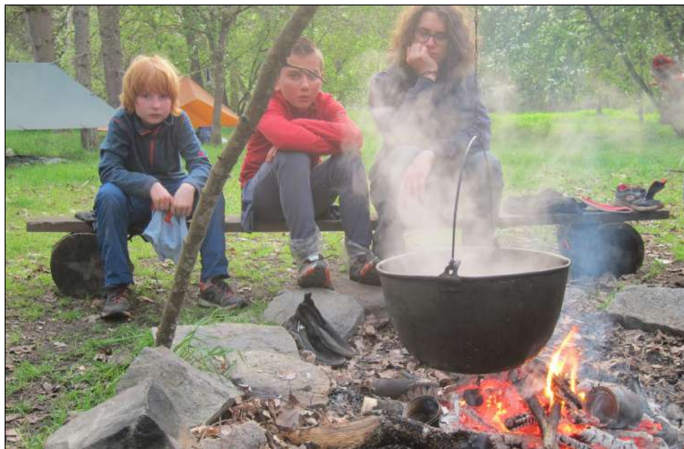
Kdy už to miláno bude?