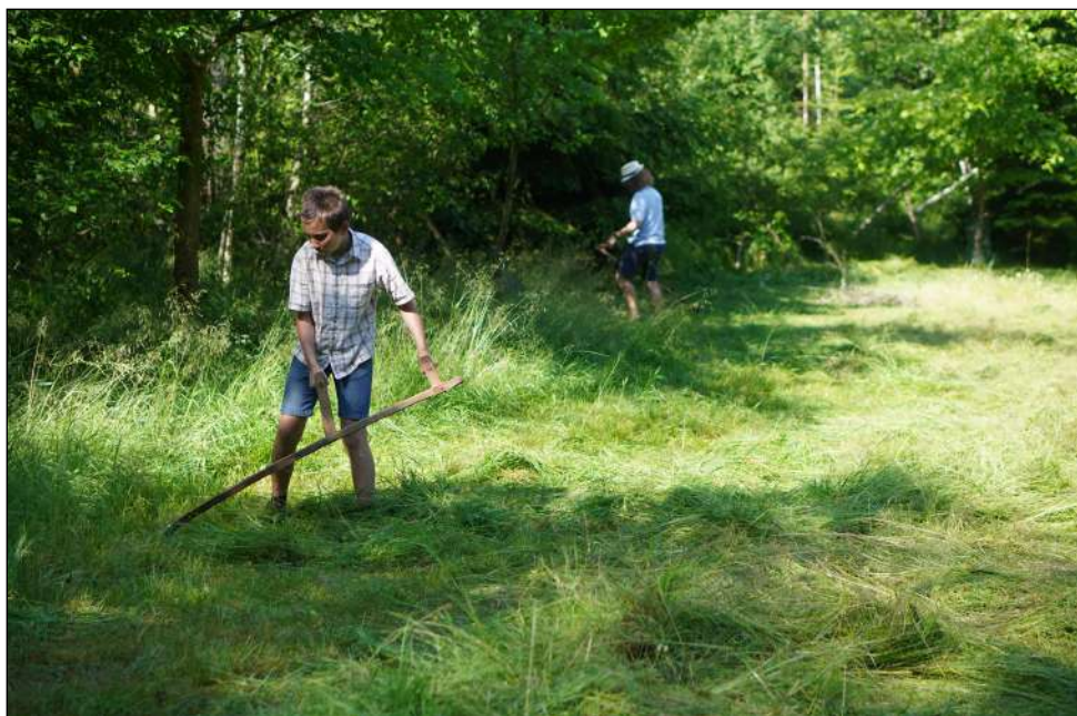
Zkušení kosiči (či sekáči?)