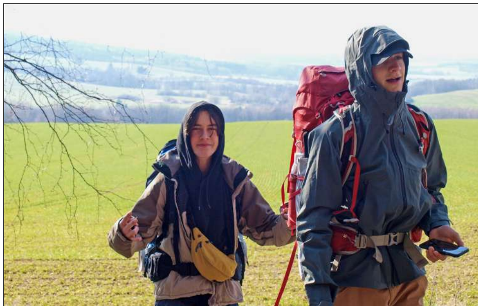
Vypadá to, že nebylo úplně teplo

py. Dorazili jsme tam dokonce dřív, než se většina probudila, takže jsme se dokonce stihli nasnídat müsli. Chvilí jsme se poflakovali po chalupě a před polednem jsme pomalu vyrazili na výlet.