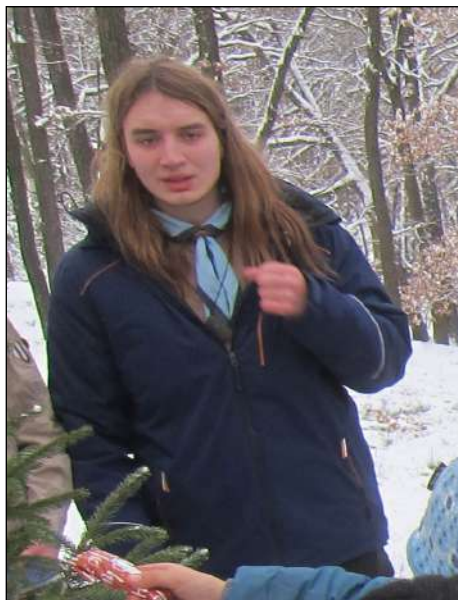
Nově zvolený přemysl