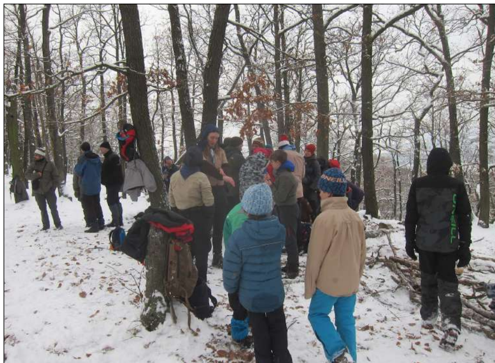
Tlačence kolem ohniště