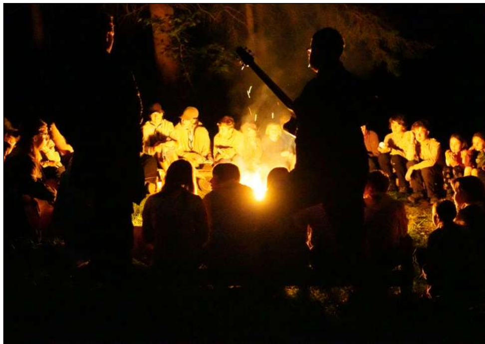
Slavnostňák (bylo nás prý skoro 60)