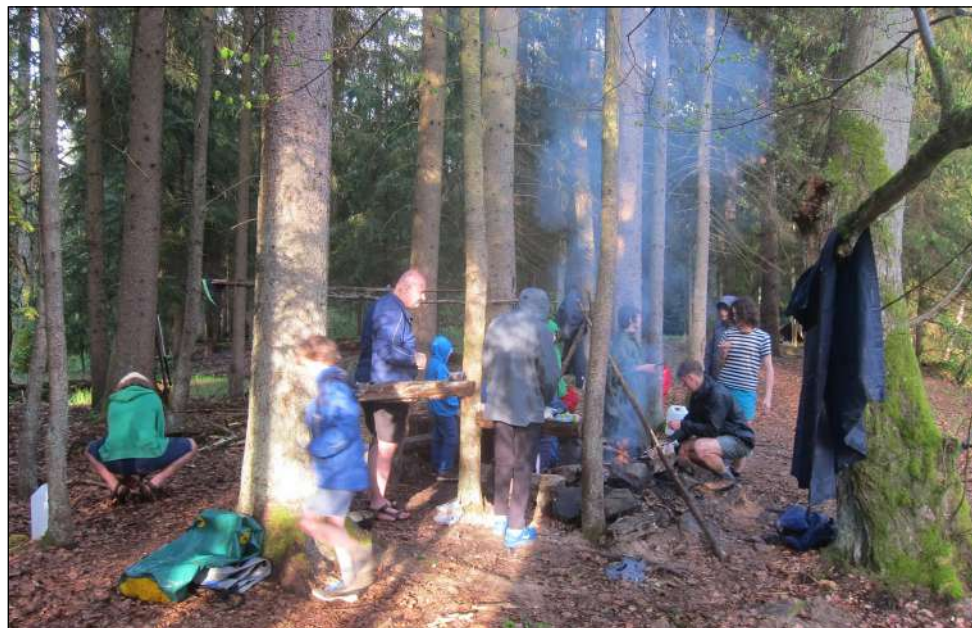
Čekání na večeři