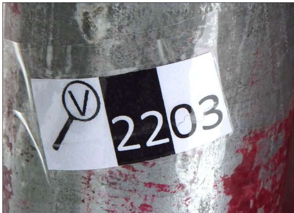
Kódy používané ve hře