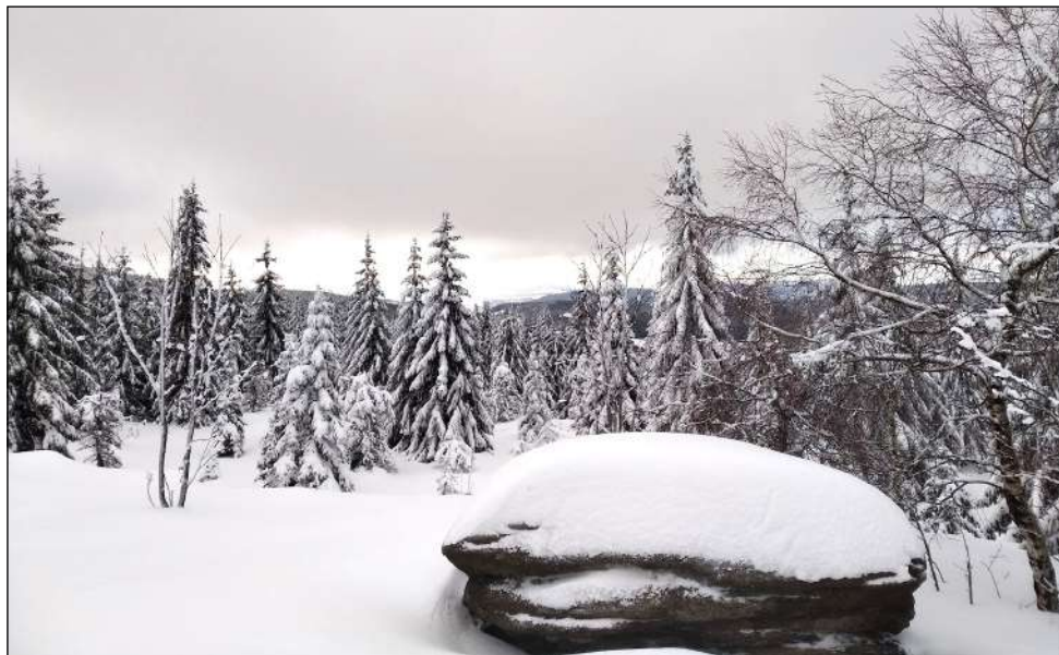
Ilustrační šutr kdesi na trase

nahoře (na Promenádní), byl již sníh měkčí a tolik to tam nejelo. Všude bylo hodně lidí, tak jsem se rozhodl oběhnout 'sněhuláka', kde bylo skoro liduprázdno. Tak trochu jsem chtěl odbočit i na Smrk, ale nebylo to tam projetý, tak jsem od toho raději upustil. Místo toho jsem jel na Smědavu a z ní nahoru na Knajpu. Tam už to byl zase jeden velký Václavák. Na nedalekém rozcestí (Čihadla) jsem načerpal energii z ještě docela dobrého chleba a kouknul do mapy. Svůj cíl jsem si ráno stanovil na 50 km. Zatím jsem jich měl za sebou cca 28, do chalupy to bylo zpět asi 12. Tak jsem si řekl, že se ještě projedu 5 km tam a zpátky. Poté, co jsem dojel na místo otočky, se mi ale nějak přestalo chtít jet zpátky do toho kopce. Tak jsem to vyřešil tím, že jsem sjel ještě více z kopce až na Kristiánov. Tam už mi nezbývalo nic jiného, než začít stoupat. Netrvalo dlouho a huště se rozsněžilo. Do kopce to až tak nevedlo, tam mi to leda tak trochu pomohlo. Ale když jsem dojel zpět na Knajpu a měl jsem před sebou 12 km mírně z kopce či po rovině, najednou to jet přestalo. Asi 3 centimetry nového sněhu mě tak patřičně zdržely.