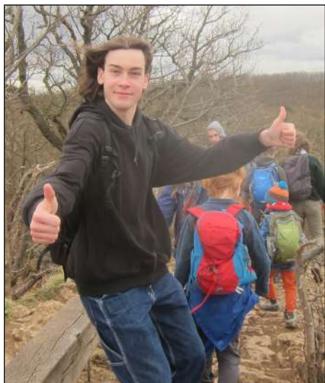
Už dává 5 hvězdiček z 5

zil! Svoje děti posílá k 'nepřátelským kmenům', do nějakého jiného oddílu. Po chvíli ale vystupují, a my tak zůstáváme osamoceni.