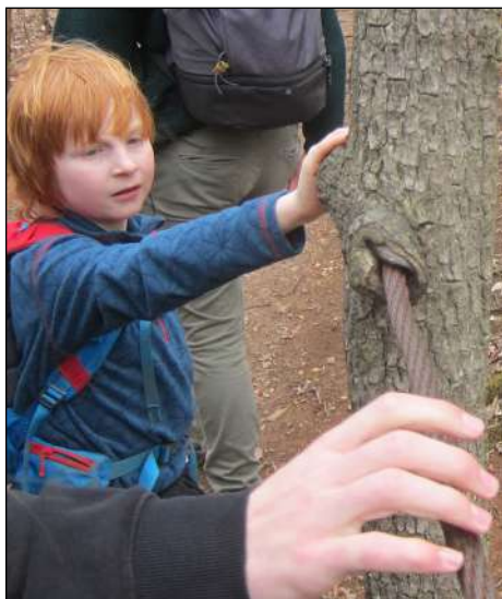
Strom si poradil