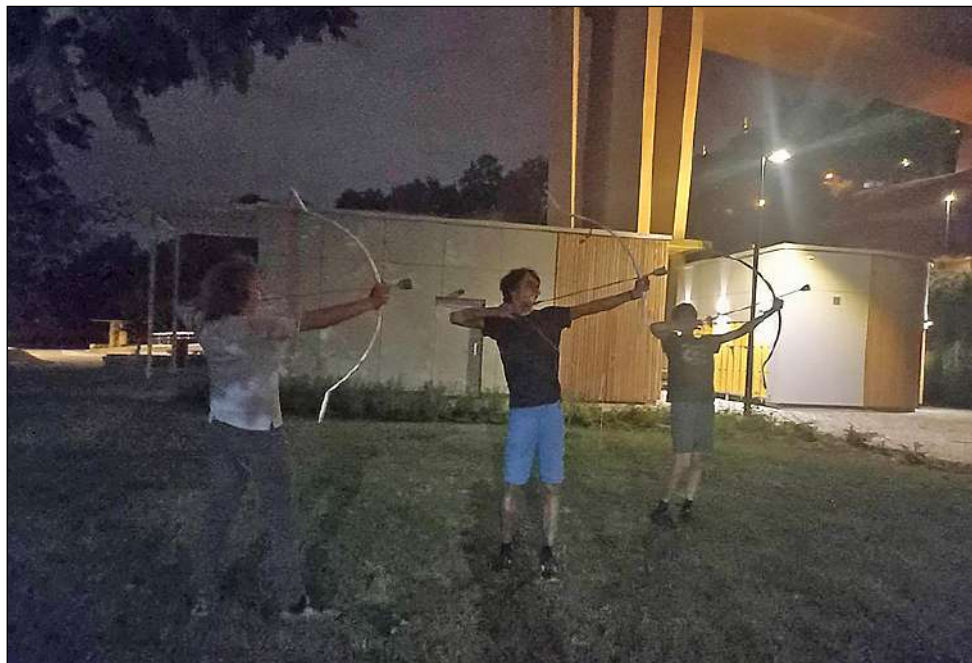
Zkouška na Folimance

(Pro zajímavost: jeden luk vyšel v přepočtu asi na 100 Kč, což je dobrá cena, na to, jak pěk- ně ta trubka střílí. Formu rádi půjčíme dalším nadšencům a nějaké know-how už teď také do- kážeme poskytnout, takže směle do další výro- by! Pozn. Petra.)