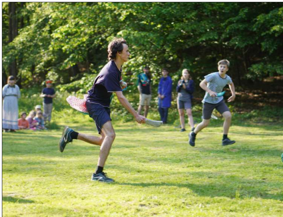
Závěrečná hra „v aréně“