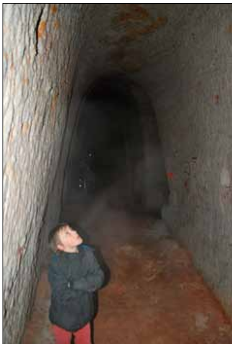
Kaolínový důl Orty

cem tužek. Ve Vídni vyrábí napodobeniny bílé anglické keramiky Wedgwood i ala China a chystá se přestěhovat svou firmu do Českých Budějovic. Surovinu bude těžit v blízkém Hosíně, kde jsou již od nepaměti šachtičky s několika rozrážkami, odkud okolní obyvatelé brali materiál na domácí keramiku.