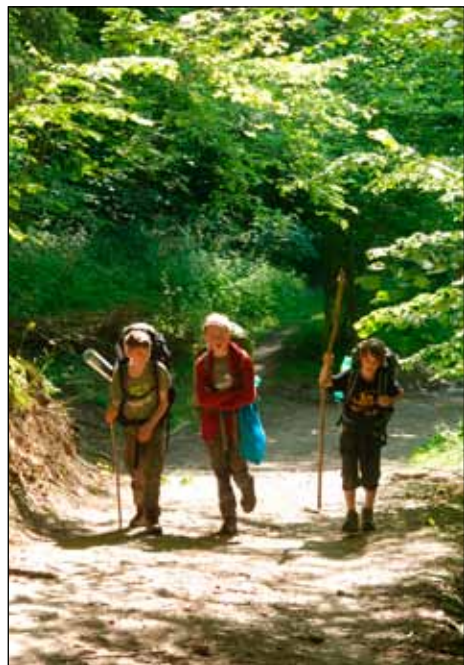
Cestou z Jablonné na Stroměč

Ráno jsme se ještě chvíli kochali výhledem při balení a pak už jsme vyrazili po cestě dolů do údolí na tábořiště U Pstru-