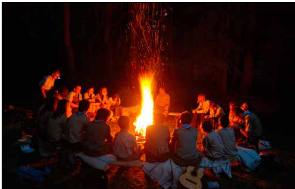
První slavnostní oheň

jsme na ně čekali marně – nenesou rohlíky, ale chleba. Takže nakonec byla stejně krupička.