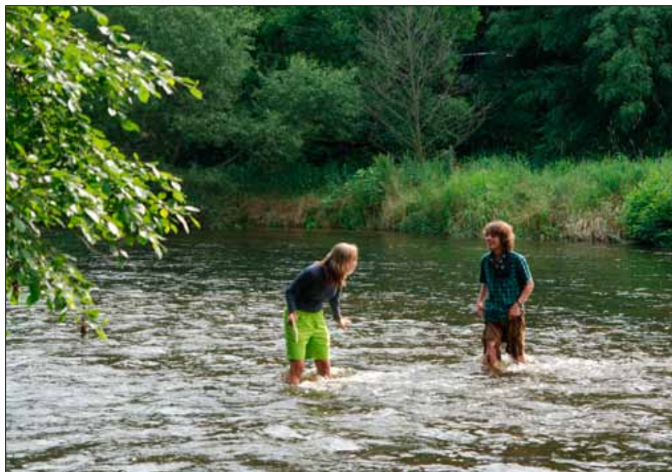
Želva a Kryšpín na Enigmě - ostrovní šifra