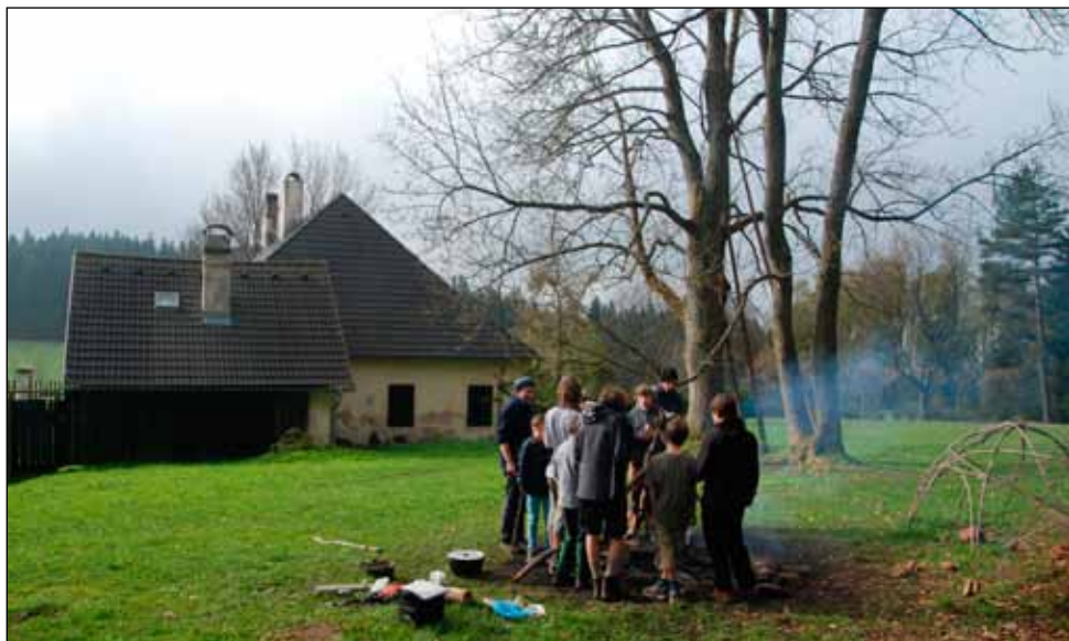
Ráno u Mášovny

Projdeme všechny chodby, kterých je kolem 70, navštívíme i úžasný „dóm“ nazývaný „Cháron“. Obdivujeme i některé v kalínu vytesané sochy. Podzemí opouštíme již za tmy a stíháme jeden z posledních trolejbusů. Procházíme kolem Hladového