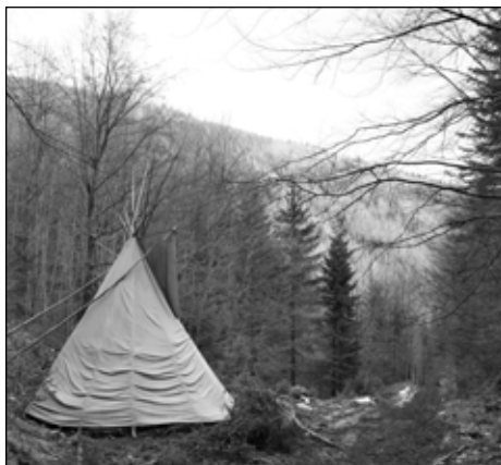
Kolem týpí žádný sníh nebyl

V zoufalé touze po sněhu jsme jeden den vyjeli vlakem do Ramzové a vyrazili jsme ne hřeben Jeseníků. Tam zbytky sněhu byly, ale v takovém stavu (rozšlapaná, přemrzlá stopa a čouhající kameny), že jen ti nejotřelejší došli až k Vřesové studánce. Většina z nás to zabalila dříve. Největším zážitkem z výletu se tak stal „chlebový dort“, který jsme si s sebou vzali k jídlu: kulatý pecen rozkrájený vodorovně a vyplněný bohatou