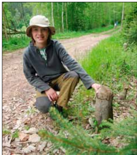
Bobří na Berounce

Když jsme se trochu porozhlídli po okolí, našli jsme pár pařežů okousaných od bohrů, docela pěkný ohryzky... K večeri byly brambory s máslem a tvarohem a pokud se nepletu, pár brambor zbylo i pro labutí rodinku, která se tam pak ráno objevila.