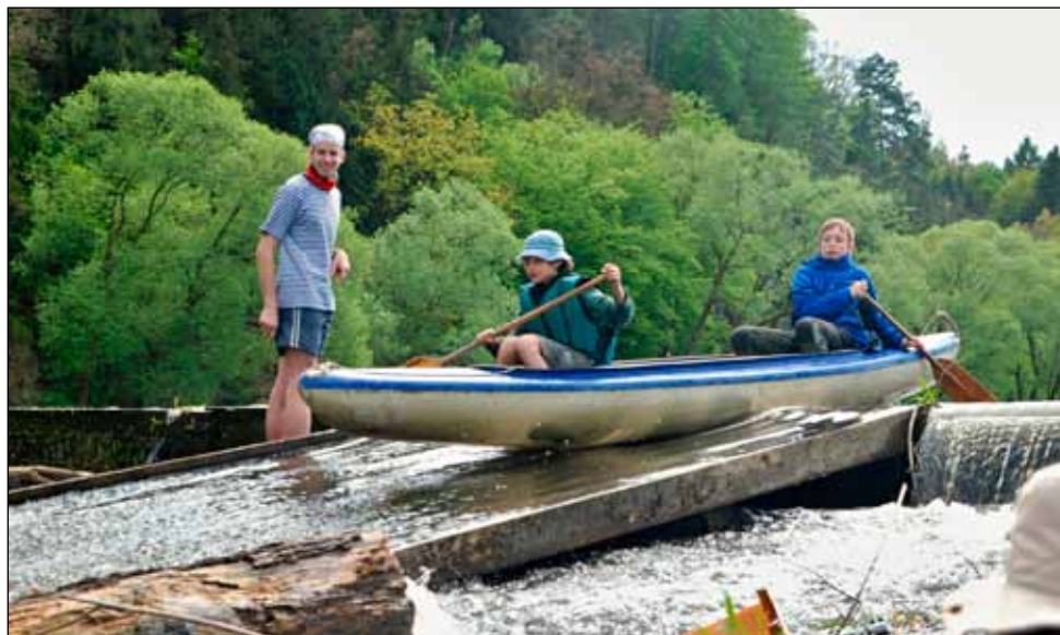
Šoupačka v Nadrybách

si tak opatřila spoustu kabelů a já, mimo jiné, novou baterku do telefonu. :)