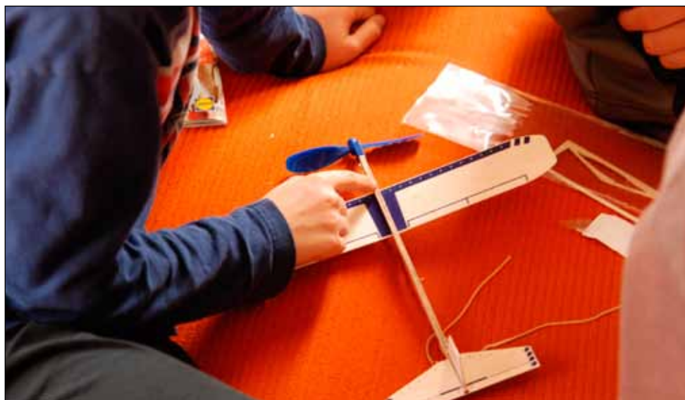
Mladí modeláři v praxi

Slavnostní oheň proběhl na zřícenině hradu, kde nás našel i Krup a zahrál nám ovčáky čtveráky, které měl dobře natrénované z domácí hudební produkce. Uspřádali jsme i celodenní výlet do okolí, během kterého jsme se značně unavili, zjistili