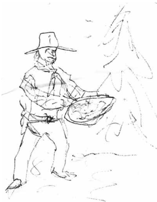
Zlatokop, kterého nám nakreslil kolemjdoucí lyžař na pololetkách v Desné