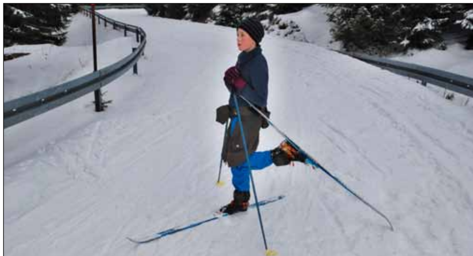
Pupíkova elegance sama