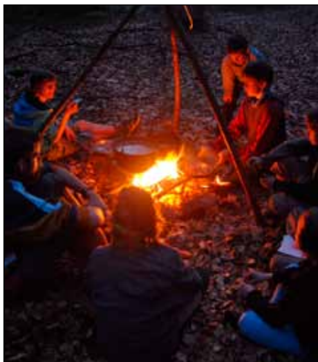
Vař hrnečku, vař ...

S Věšákem jsme se připojili až v pátek večer, na tábořišti v Malčicích. Ráno (nebo spíš dopoledne) jsme vytlačili kola přes Brusnické chalupy na Zahradky na silnici (byl to boj a trvalo to víc, než 2 hodiny, takže jsme si museli dát cestou oběd