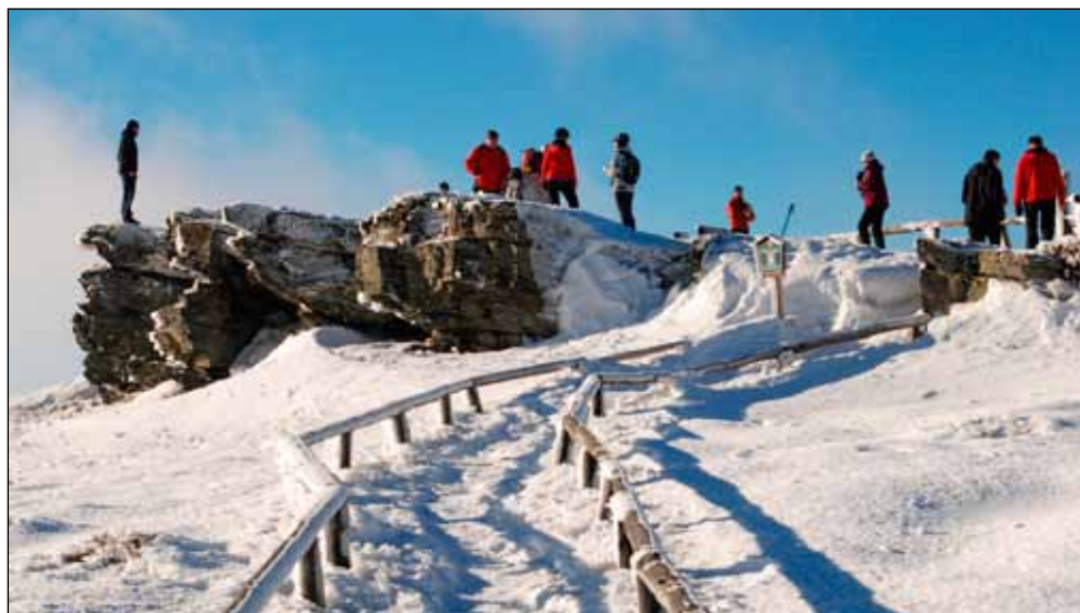
Na Šeráku zbytky sněhu byly