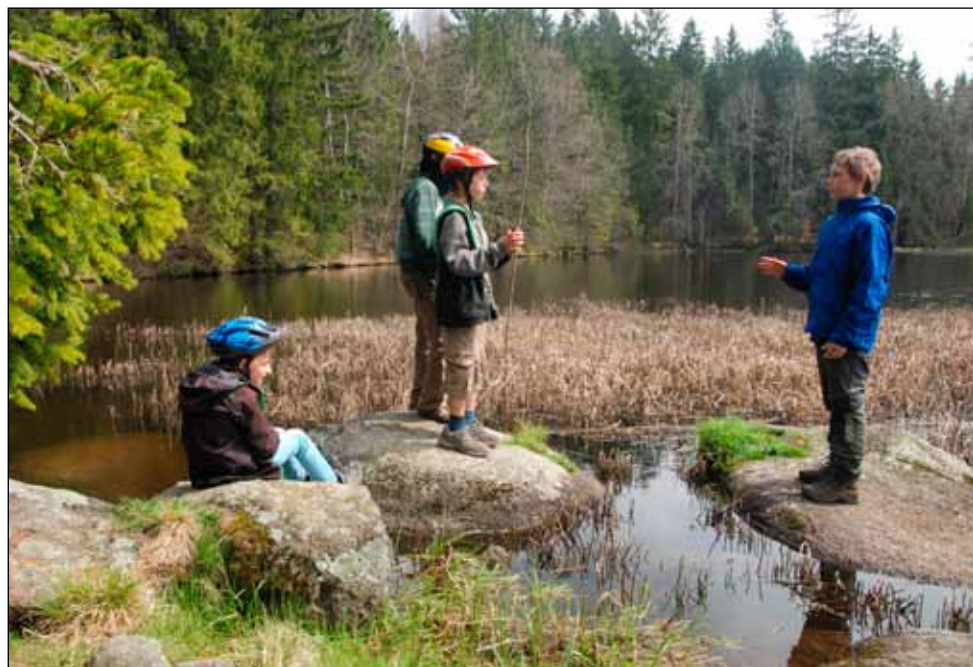
Polední pauza u Hušského rybníka

- salám s plísňovým potiskem). Dál to už byla celkem pohoda - sjeli jsme přes Močerady do Rožmitálu a pak zvlněnou krajinou po silničkách do Dolního Dvořiště