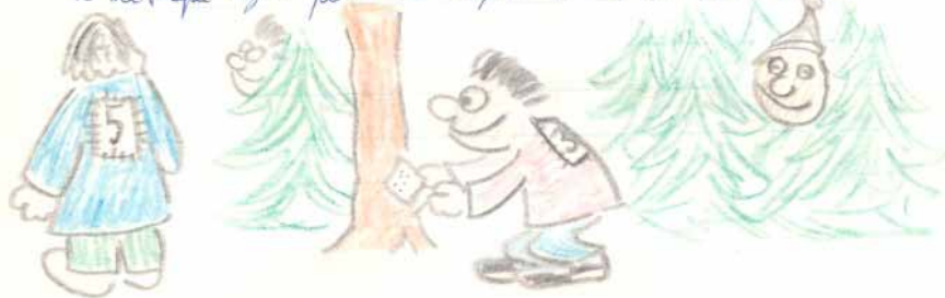
Zápis z tábora U Pstruha 1979, kronika Žraloků

slušku milu modrá dužička. Hrána a Marek absolvovali. Kluci se vrátili + Prachy. Začalo se stavěnat ležky a cizí vo. Odpoledne po krátkém čistění byla hra. Měli jsme na tačcech přičítat desky a násilně uholen bylo týčiček 80sto osatůček. Vybral Tom přect krtkům a úřáhem. Po náčtyku bylo po němš alyte a krtky řel bolet.