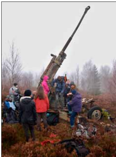
Houfnice (= houfnice na Houpáku)

Padla mlha (tedy „nepadla“ – zůstala viset ve vzduchu). Pak jsme se stočili směrem na hlavní hřeben, kde jsme chtěli spát. Asi po hodině jsme došli na významnou křižovátku se silničkou a Kule se, s výkřikem: „Pojďte za mnou, já to ta-