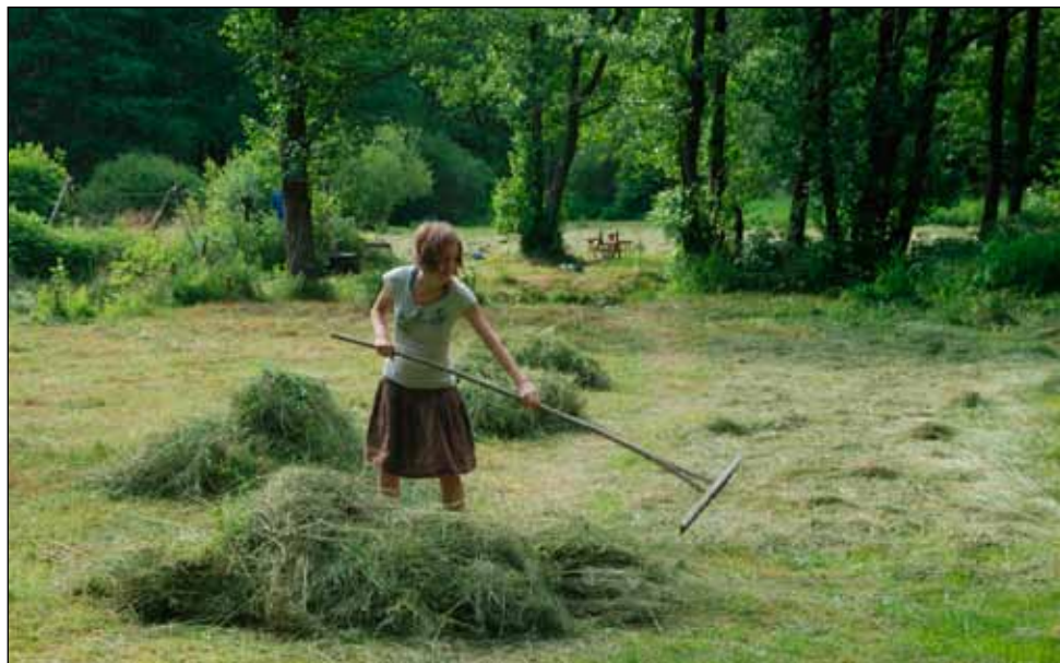
Namísto fotky z družinovky přikládáme fotografii z přípravy tábora - proběhla tradičně před táborem. Děj je v podstatě každý rok totožný, proto jsme se rozhodli umístit pouze fotku bez zápisu.