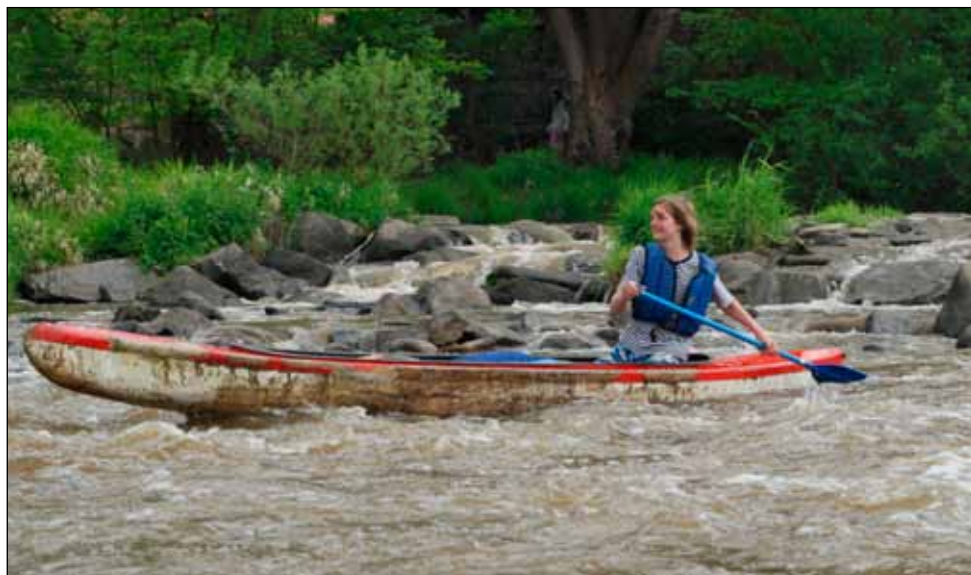
V Kamenném Přívoze