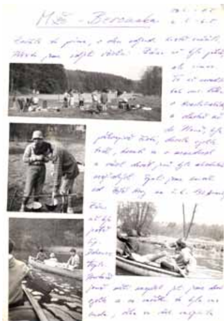
Fotodeník 1984 Berounka