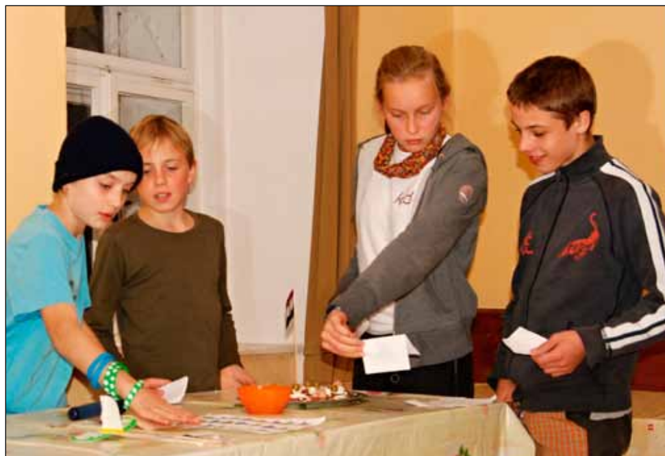
Slovinci připravují jídelniček