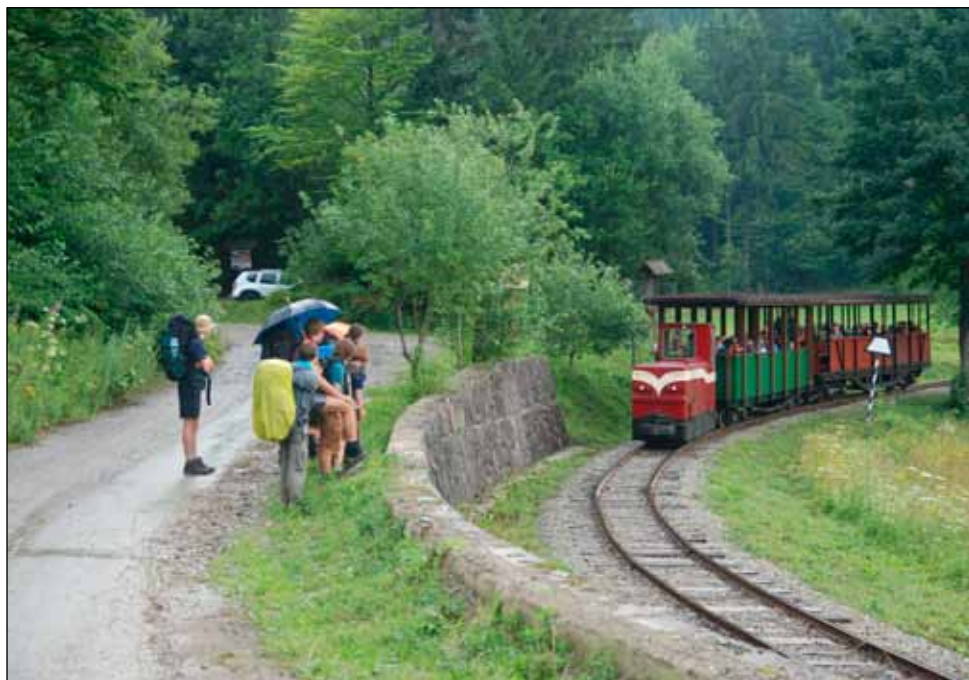
Úvratová železnice Oravská Lesná

Když jsme byli v půlce vaření brkaše, zastavilo před stříškou auto polovnické strážže. Vylezl chlápek a zařval: „Nazdar chalani!“ Čímž nás trochu překvapil. Ukázalo se ale, že si nás nejdřív zřejmě s někým spletl, protože pak na nás chvíli zíral a potom pomalu přišel s ne úplně přívětivým výrazem. Nicméně jen prohlásil: „Zajtra to tu bude jako na fotke.“ A odjel. V noci na mě spadla Patova knížka.