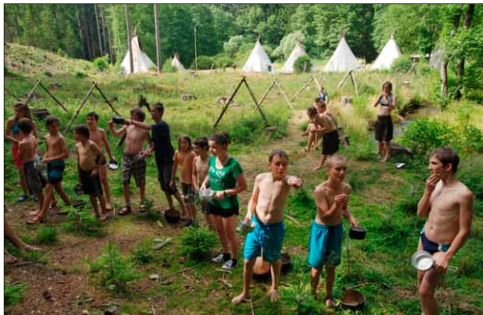
Získávání vody propíchnutím balonků naplněných vodou. Před startem

Po obědě přijel Alfons a přivezl dlouho plánované překvapení: Týmy se měly do- stavit ke staré sauně a tam na ně čekali čty-