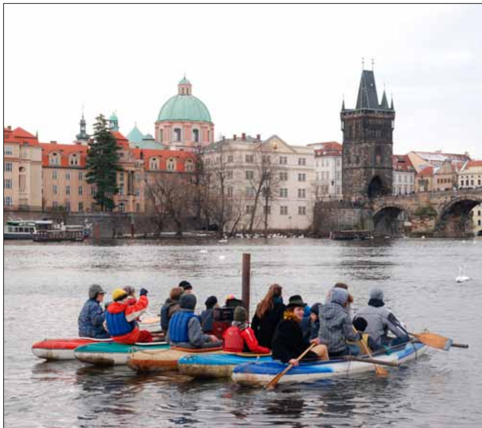
Vzhůru pod most (Guláš 2013)

Neporazitelný soukromý detektiv Nick Carter přijíždí do Prahy řešit případ, s nímž si zdejší policie neví rady. Je vyzbrojen geniálním mozkiem a nejnovějšími převratnými vynálezy, cestou z New Yorku se dokonce hravě zvládl naučit češtinu. Na místě, zejména v malebných hospůdkách nad orosenou sklenicí, ovšem zjišťuje, že v Čechách všechno chodí trochu jinak než v Americe. Podaří se mu překazit ďábelské plány zločinného hraběte von Kratzmar a zachránit květ nevinnosti líbezná Květušky?