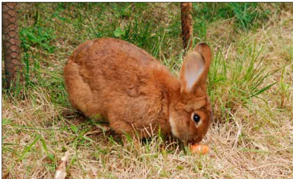
Jeden z našich čtyř králíků (asi Bertík)

ři králíci. Všechny nás překvapilo, jak jsou chlupáči velcí. Řekli jsme si, že to je dobře, aspoň budou životaschopnější a hodně toho vydrží. Na konci tábora je musíme v pořádku vrátit. Tady jsou: