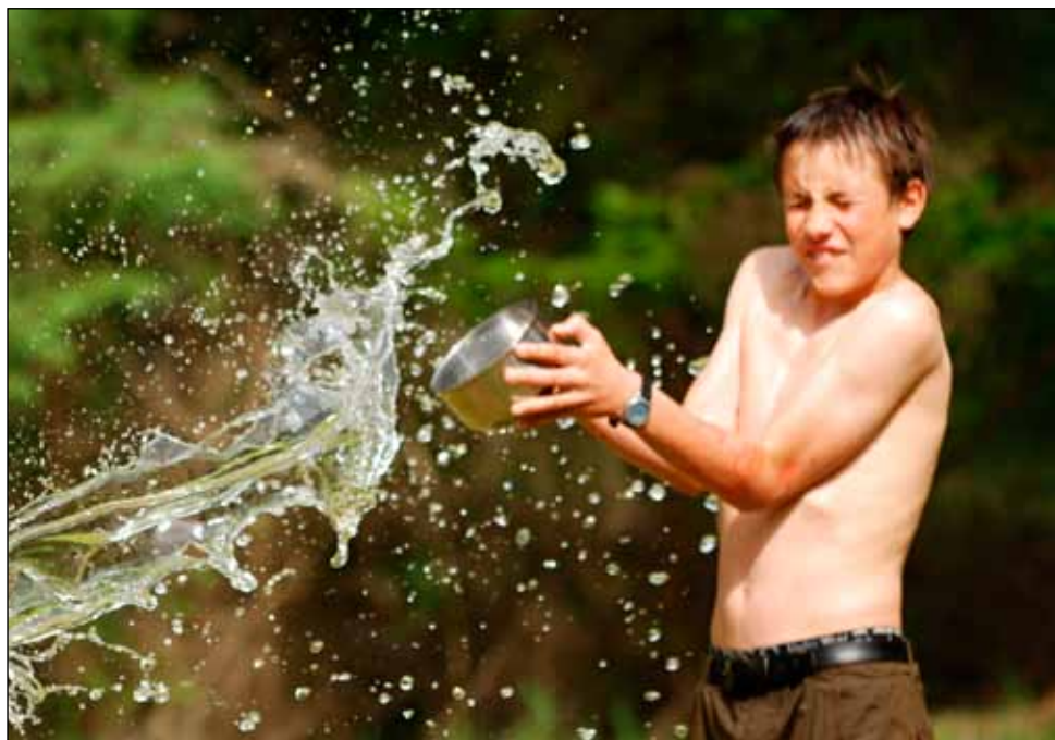
Chytání vody (Bohoušek)

slíbil, že až pojedou do Budějovic do nemocnice, koupí nějakou lepší desku.