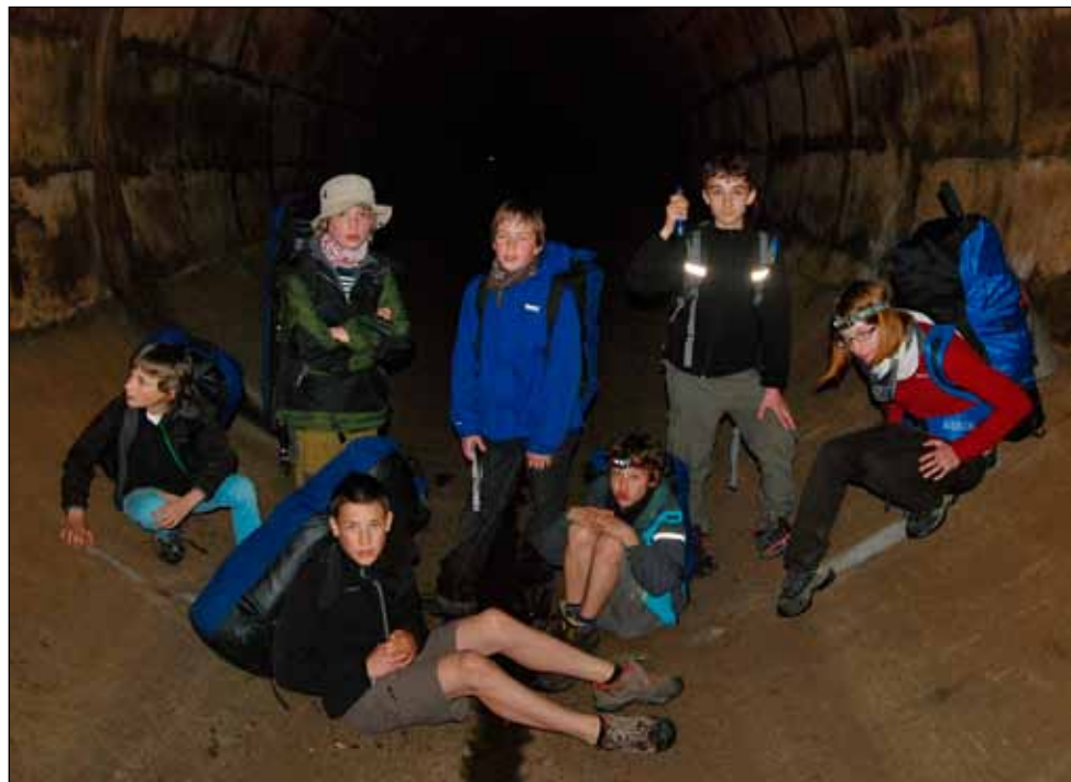
V derivační trubce přehrady na Klabavě