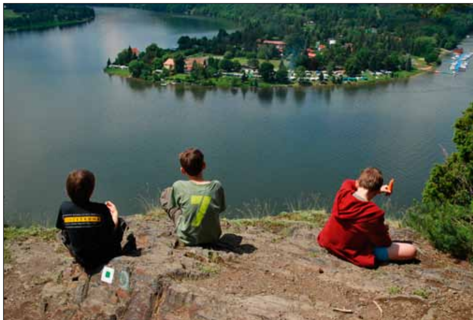
Vyhledka na Živohošť

Arcikam získali nakonec všichni a myslím, že jim chutnal.