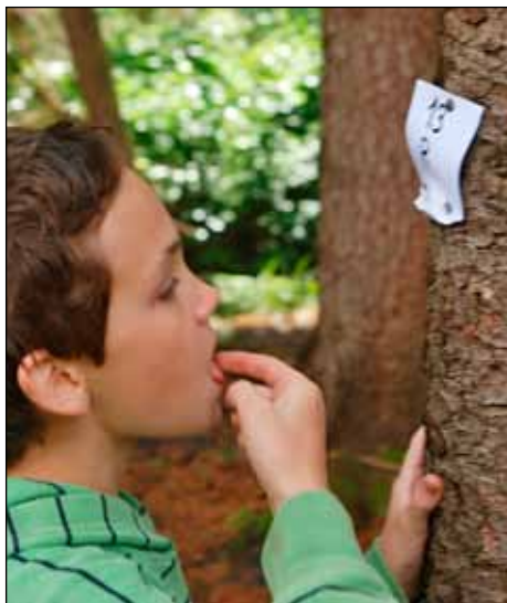
Úvodní hrátka. Podle výrazu tváře to není sůl ani kyselina citronová.

Amálka vysvětluje Vabukovi co znamenají slova v písničke „Co jsem žlel bles