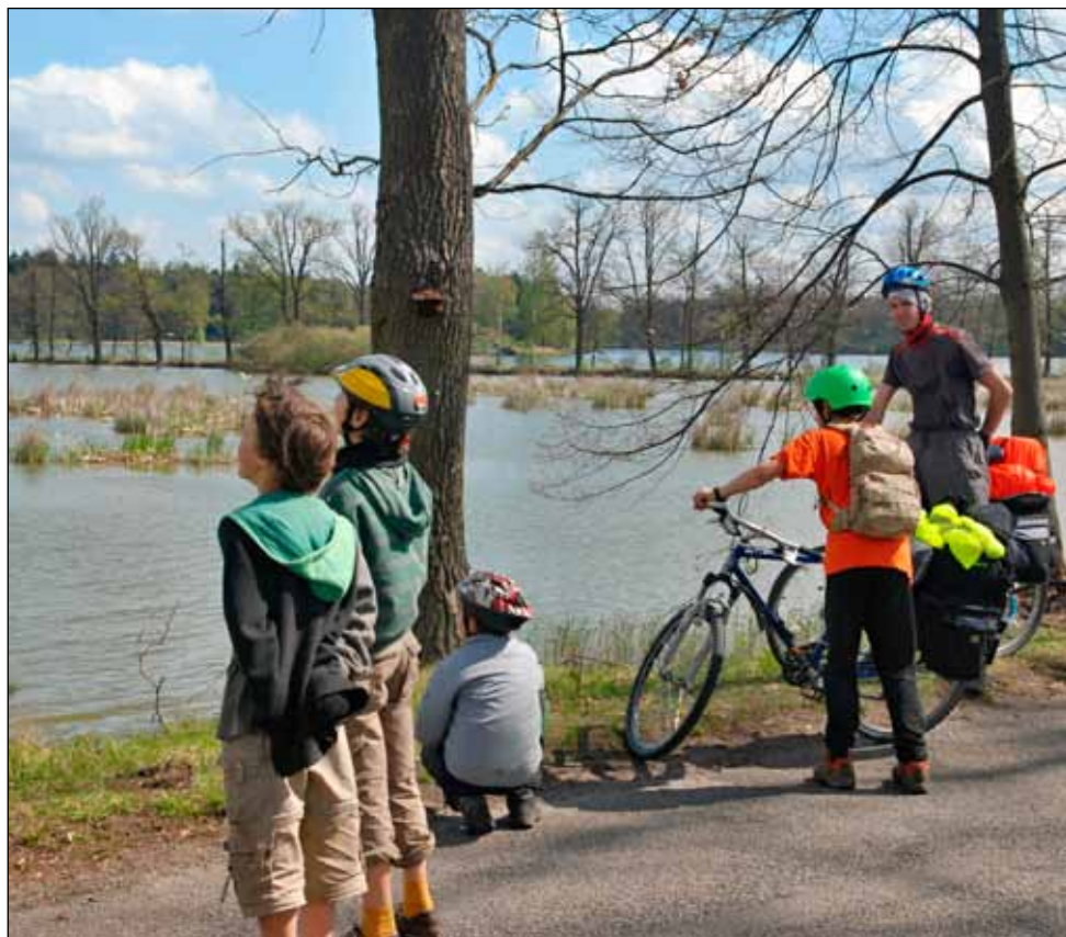
Prohlídka ptačí rezervace