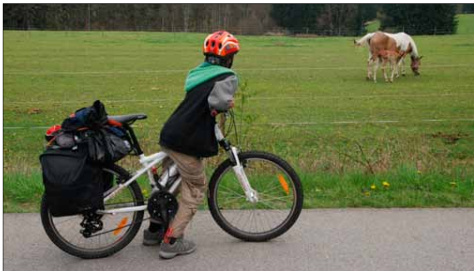
Kolik máte koňských sil?