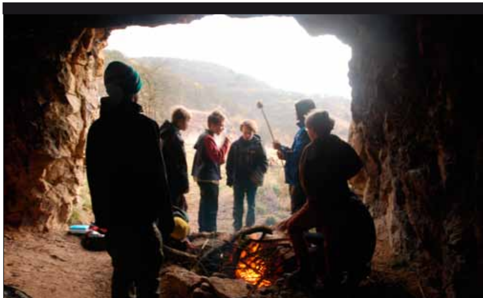
Člověk jeskynní ( homo spelaeus )