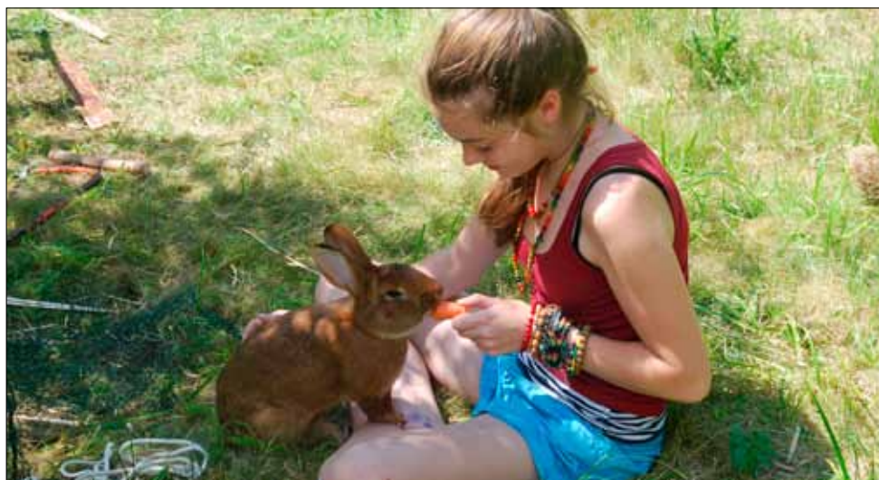
Není nad vydatný oběd