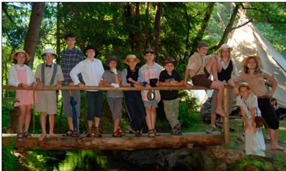
Naše expedice do Ztraceného světa

zjistí později. Aha. Uplavala rovněž zadní lávka.