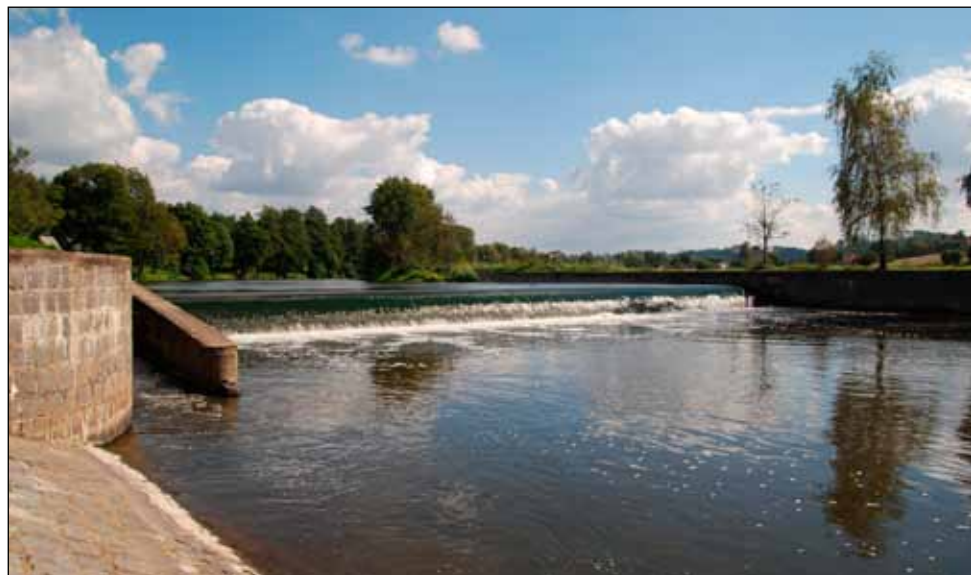
Jezy jsme konili

Po dlouhém hledání tábořiště jsme se nakonec smířili s vysokými příkrými břehy zarostlými kopřivami. S menšími