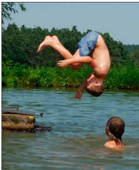
Hadí si koupání v nádrži náramně užívali

nic neříká. O to víc nás naštvalo, když první hru vyhráli oni. Druhá bohužel skončila remízou, a tak jsme se dolu do tábora vrátili s pocitem, že jsme dostali na frak. Hned potom se ale vyrazilo na závěrečňák.