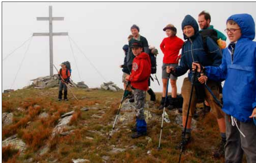
Vyhlička Orlová (cestou na Královu Holu)

Šepta si stěžuje, že už ho puřák moc nebaví. Kule: „No jo, chudinko. Ono je to celý vlastně úplně k ničemu, jen tak chodit po horách sem a tam.“