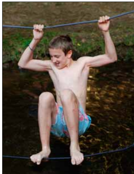
Servicovi se nechce do ledové vody

Včera večer jsme hráli nějakou hru s Medvídkem. Byla jejich, a tak znali strategii, což byl jeden z důvodů, proč s přehledem vyhráli. Taky zmasili pár našich menších, protože všichni začli křičet, že chtějí odvetu. Dnes ráno se tedy hrály naše Kolíky. Bylo nás strašně moc: 20 na 20, a tak vznikaly dosti patové situace. Rovněž začaly obvyklé hádky o dodržování pravidel, ještě podněcené vládnoucí nevráživostí a soutěživostí mezi týmy. Medvídkáři jsou banda paviánů a fairplay občas některým z nich