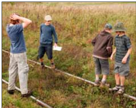
Tak kdy už konečně pojedete?!

Ráno. Hadi si pečou cukr na klacku. Balíme. Je dost pozdě. Vyplováme a brzo vidí-