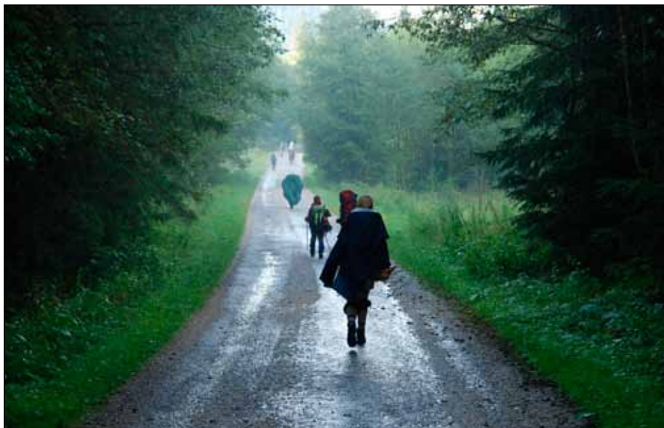
Jeden z prvních dnů na chvíli sprchlo

nit batohy a všichni by měli rázem fazolek dost, ale nebylo to povoleno.