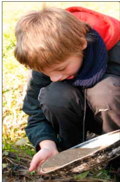
Kryšpín rýžuje zlato

Rychle jsme uklidili a vydali se do Moravské Třebové na vlak. Cesta byla nádherná - udělalo se nečekaně teplo a