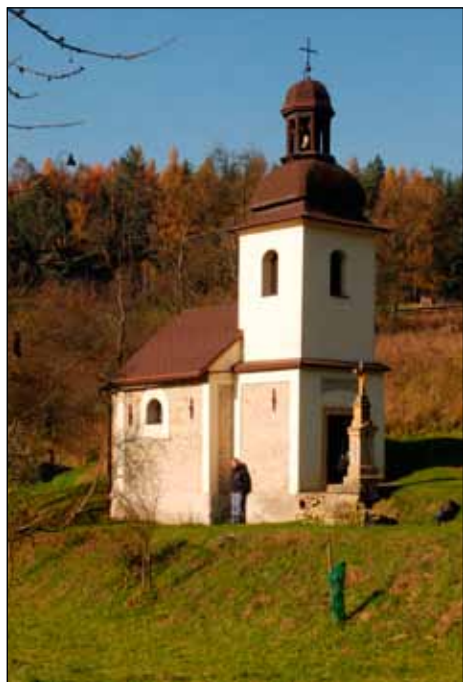
Kaplička v Žipotíně

Tři různé stoly slibovaly možnost výhry: U jednoho se hrál macháček, u druhého oko bere a u třetího se vesele točila ruleta. Navíc tu byl stůl čtvrtý: ten se prohýbal pod všemožnými pochutinami: od jablečného kompotu přes sušenky a mléko k palačinkám s marmeládou. Za jídlo se samozřejmě platilo.