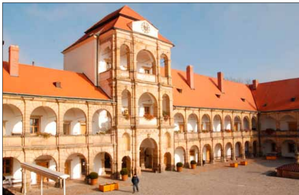
V Moravské Třebové jsme si zahráli hru a prohlédli si místní zámek

Večer si mladí zlatokopové vyslechli, že cest, jak na Aljašce zbohatnout, bylo vícero. Jedna z nich vedla skrz hazard. A tak byli všichni pozváni do jídelny, kde mezitím vyrostlo kasino. U vchodu si za vyrýžované zlato koupili žetony... a hurá dál!