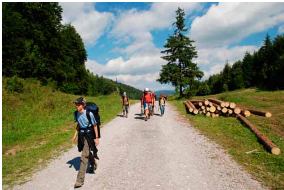
Občas do nás slunce pěkně pražilo

Hyp: „No, puťák přece musí být úplně k ničemu. Protože kdyby to k něčemu bylo, tak to přece Kule nedělá.“