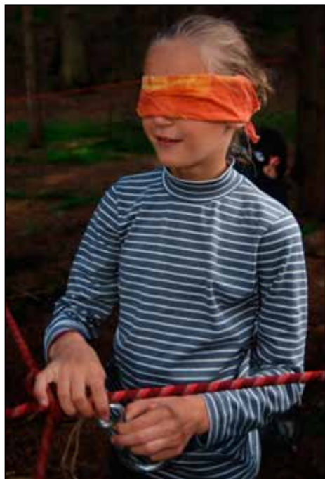
Každý předmět bylo potřeba důkladně ohmatat

krvelačnými výrazy ve tvářích), ale sypká půda mu nedovolila než sjet pomaloučku až k nám. Hroch ho slušně požádal, jestli by příště mohl jet jinudy, načež si čtyřkolkář zřejmě oddychl, že ho nečeká rána lopatou po hlavě, odpověděl, že samozřejmě, a začal urychleně odjíždět zpět nahoru. Motor jeho vozítka ale nebyl dostatečně silný na boj s podkluzujícím jehličím. Nakonec se zapřel zadkem o strom a hrabal na místě. Bavili jsme se dohadováním, zda nás příleze požádat o pomoc, nebo tam takhle zůstane. Tatouch prohlásil, že měl-li ten týpek meloun n akoupí čtyřkolky, bude mít v kapse další na zaplacení pokuty, a že bychom na něj tu policii klidně mohli zavolat. Mezitím se ale čtyřkolkáři s vypětím všech sil podařilo dostat se nahoru, s menšími potížemi se vyhnul Hrochově autu a zmizel z dohledu.