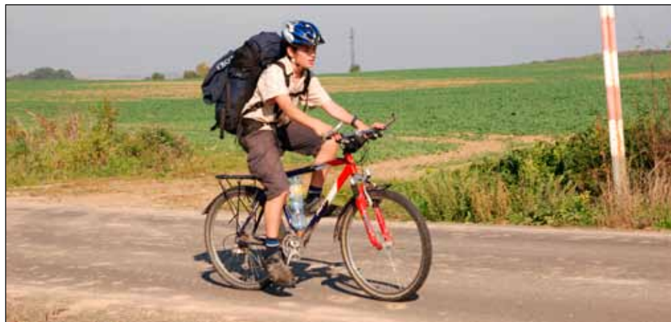
Hadi jeli na sraz na kole

Šlo se vařit... To, že jsem čert, mě ani nezaškočilo, protože nebyl nikdo jiný, kdoby mohl být. Se sekerou jsem odešla k batohu, vytáhla jsem jídlo a jdem... Budeme vařit palačinky