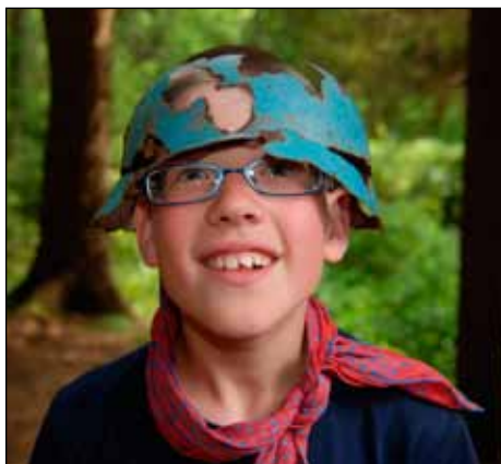
Bobeš je na cestu bludištěm vybaven přilbou

Právě nám uplavala sklípek. Jednu konev chytil Hroch už u zadní lávky. Něco bílého ale prý zmizelo v dáli. Co to bylo, se asi