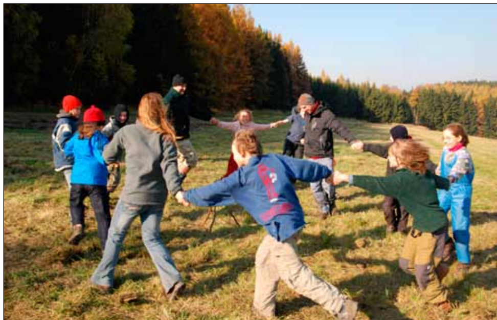
Naše oblíbená hra – trojnožka