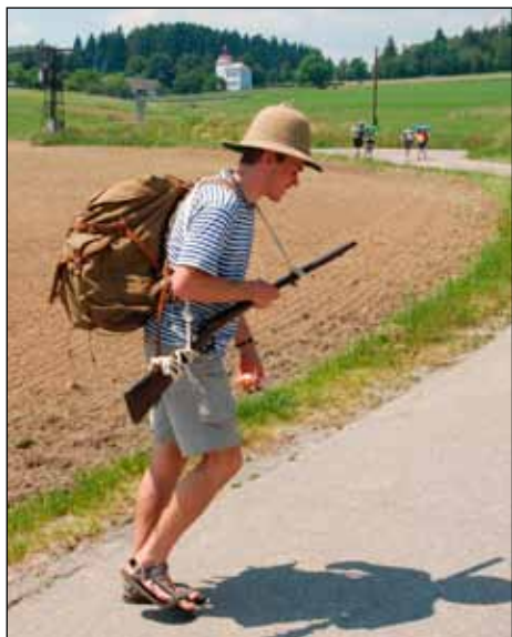
Maďal jako jeden z členů výpravy