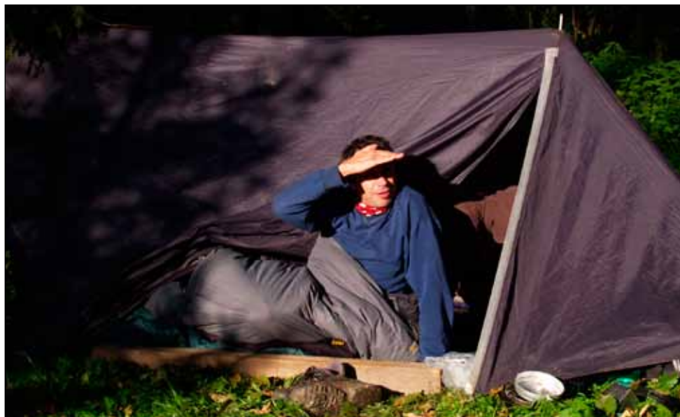
Kule po ránu: všichni už jsou na nohou a pracují, jen jemu se z teplého pěřového spacáku nechce