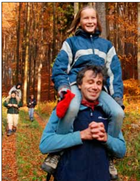
Chromá Želva si našla nosiče