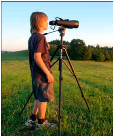
Na Lověšických rovinách