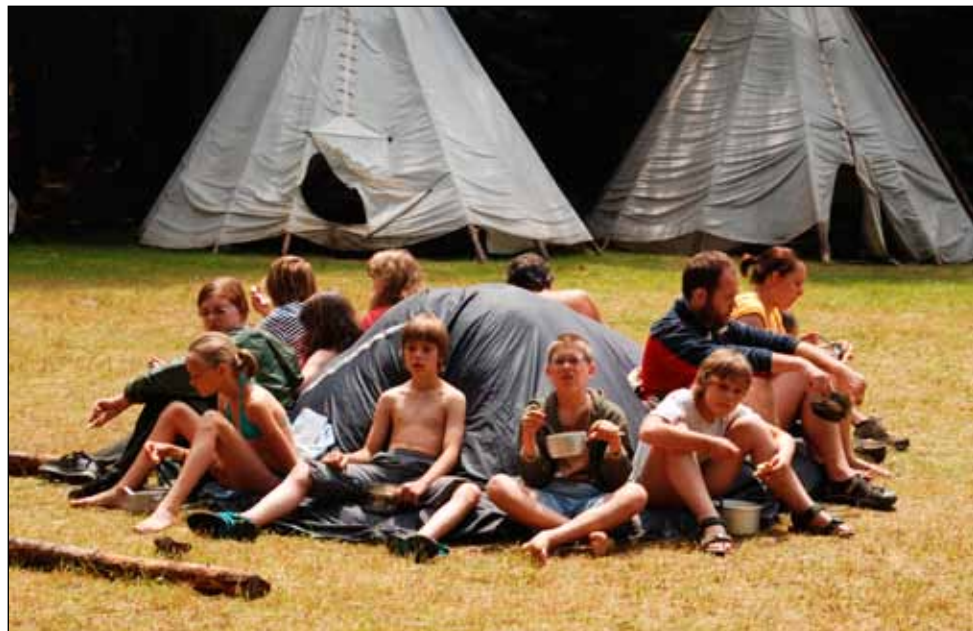
Oběd na naší oblíbené kupce sena