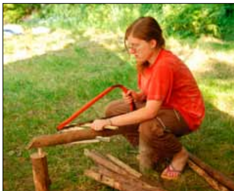
Brepta staví postel

Terryrna se plete pod nohy. Service ji prý dokonce omylem shodil z lávky do