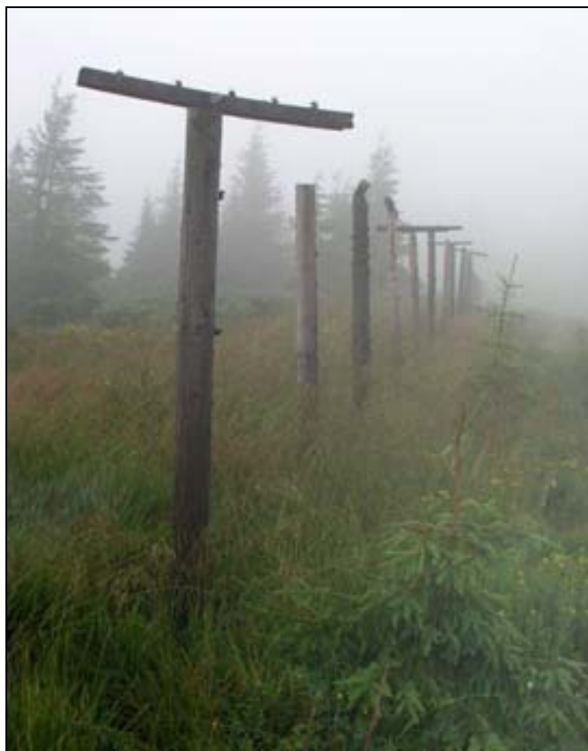
Trosky hraničního plotu

Udělalí jsme pár nezbytných snímků odjíždějícího vlaku, poté jsme shledali, že drobně prší a vlezli jsme do čekárny s kachlovými kamny. Přebalili jsme batohy a vyzbrojili se proti dešti. Také jsme nakoukli do starobylé dopravní kanceláře (s jinými zajímavými kamny) a prozkoumali ekologický odpadkový koš, který má sice z každé strany výcejazyčně označený otvor na jiný druh tříděného odpadu, vše však padá do jedné jediné nádoby. Neradi jsme nasadili batohy a vydali se do vsi, kus po hlavní ulici a pak odbočkou do horského údolí. Právě se tam konal nějaký trh, všude byly davy domorodců a my jsme budili značnou pozornost. Po mostě jsme přešli řeku a pokračovali dále po drum carroserului , stále poměrně