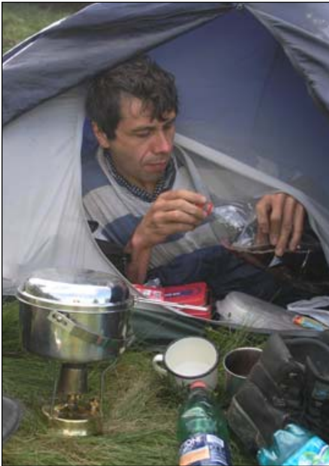
Vaření čaje nebo jum-jumek rovnou „ze stanu“ bylo kromě spaní často jedinou činností, jíž jsme trávili deštivá dopoledne

maďarsky, ale našli jsme tam adresu na autory a řekli jsme si, že jim napíšeme, ale zatím jsme to, pokud vím, neudělali, a tak to tu připomínám. Pak jsme ještě narazili na přátelského ukrajinského turistu, klesli jsme do sedla a začali jsme se za vydatné pomoci rukou drásat příkrým průsekem na vrchol Stohu (Vf. Stogul, 1651m). Ten zdobí původní válcový žulový patník s vyznačenými směry hranice, jen staré znaky a nápisy jsou otesány a ještě je čitelný nový nápis CCCP. Udělali jsme vrcholové foto, snědli kyselé rybičky a zkoumali hřebeny na bývalé československo-polské hranici s Černou horou a troskami mohutné kamenné hvězdárny, kde jsme byli o 8 let dříve. Ale to jen do chvíle, než jsme zjistili, že se odtamtud na nás žene déšť. To jsme se sebrali, seběhli ze Stohu a ještě pokračovali přes travnaté pláně takové tři kilometry k místu, kde se hranice v ostrém úhlu stáčí k severu. Tam už opravdu lilo, zjistili jsme,