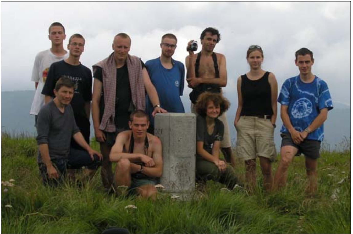
Vrcholová fotografie ze Stohu

mušek. Ze všech nejvíc je přitahoval Jírovec, který nám chvílemi téměř zmizel z očí. Všude rostly obrovské spousty borůvek. Na jednom místě (naštěstí přímo na čáře) jich byly takové davy, že jsme neodolali a zastavili jsme. Někdo pronesl, že je tam ty pohraničníci určitě mají nalíčené na turisty, a v tu ránu tam byli – dva rumunští vojáčky (měli modré maskáče, aby nebyli v borůvkách vidět). Opsali si údaje z pasů, mimo jiné i vstupní razítko do Rumunska, a opět nás varovali před chozením Ukrajinou. Byli celkem přívětiví a rozloučili se s námi s poznámkou, že u nás v Česku máme nějak málo ženskejch. Na tomto místě jsme začali počítat, jaký je poměr borůvek a vzduchu v nádobě (za předpokladu, že borůvky mají tvar koule). Chvíli nám trvalo, než jsme se navzájem ujistili, že to nezáleží na jejich velikosti, pokud jsou ovšem velké všechny stejně (Tatouch toto tvrzení sice stále zpochybňoval, ale přesto jsme se pustili do dalších výpočtů). A tak jsme si (nejen) po zbytek dne krátili cestu