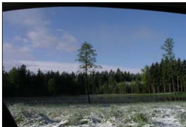
Ráno nás překvapil sníh