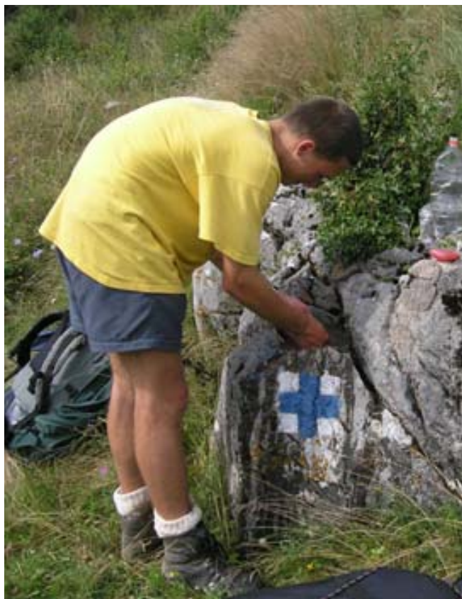
Aha, umyvadlo a turistická značka „modrý kříž“

kde jsme ještě nakoupili nějaké chleby a zahár (cukr). Z projíždějícího auta zamávali strojvedoucí se synkem (který celý den pomáhal na lokomotivě). Pak jsme přešli přes most, pod kterým byla naplavená nepředstavitelná kupa odpadků, hlavně PET lahví. A za ním, na zastávce jsme zjistili, že v půl osmé nám ujel poslední bus do Vişeu de Jos, pročež jsme museli vyrazit pěšky. Po chvíli jsme ještě zastavili na takové nevzhledné periferii a dali si něco k jídlu, pak se kolem nás začali stahovat toulaví psi a radši jsme pokračovali. Vyndali jsme světla, aby nás řidiči viděli, a rychlým tempem jsme urazili nějakých pět kilometrů k nádraží. To jsme našli s menší dopomocí místních. Pod střechou na perónu jsme se vybalili, uvařili čaj a někteří si dali br. kaši. Pak nás čekaly tři hodiny spánku, velmi příjemného, přestože jsme leželi na betonové podlaze. Ve 2:30 nás vzbudil budík a Tatouch se zeptal, kdo uklidil kulecí vařič. Podezření, že ho uklidili dva pánové sedící na blízké lavičce, bylo ale naštěstí vyvráceno. Jak jsme si balili, začali na nás ti dva pánové dohlížet,