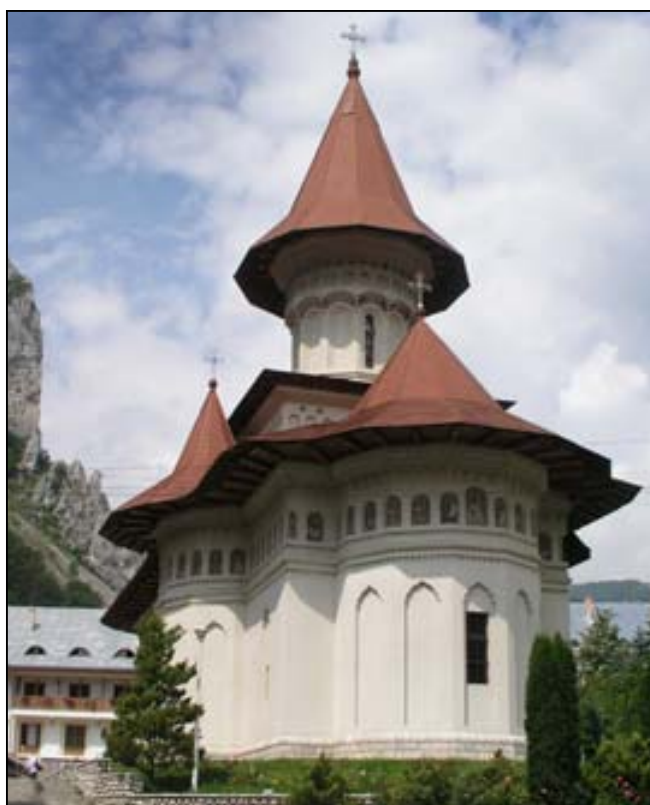
V Rămețském klášteře