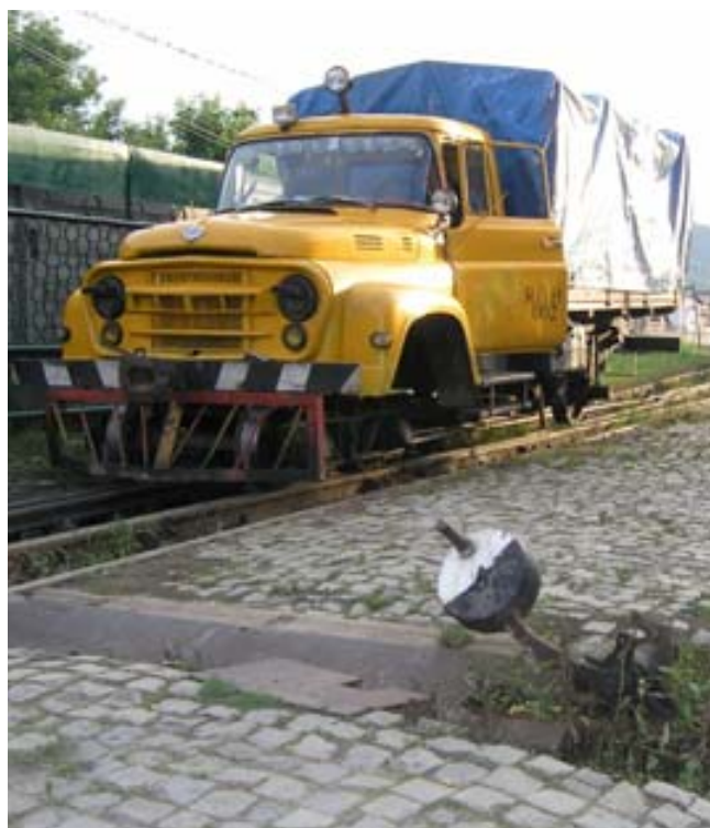
Jedinou cestou do údolí je železnice a tak po kolejích jezdí i upravená auta

zájezdu. Měli jsme smůlu, že jsme nemohli vidět pravidelné vlaky s dopravou dřeva, na druhou stranu ale bylo štěstí, že nahoru vůbec něco jelo. Kule s Ahalbertem vyrazili nakupovat a já jsem pronikl hlouběji do areálu, do depa. Dýmaly tam tři zatopené parní lokomotivy a stojí tam řady dalších, některé již jako úplné vraky. Než jsem ale stačil všechno nafotit, přišli dva týpci, jeden mi rumunsky nadával a ten druhý, takový slušňák, to volně tlumočil do němčiny, že se prý omlouvá, ale že mě musí vyhodit, protože by měli problémy se šéfem. Na otázku, jestli se můžu zeptat šéfa, mi řekl, ať přijdu v pondělí. Tak jsem se zase vrátil ke vchodu, kde jsem měl sraz s Ahalbertem a Kulem. Zakonverzoval jsem se sympatickou polskou rodinkou a jedním Američanem, který měl jakési povolení od ambassadora a dožadoval se s ním vstupu do areálu. Podnapilý zřízenec si ale se zmuchlaným papírem očividně nevěděl rady.