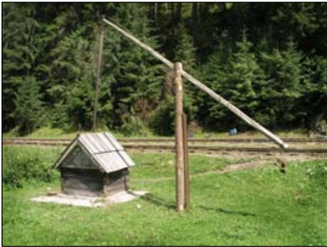
Vahadlová studna ve Fäině