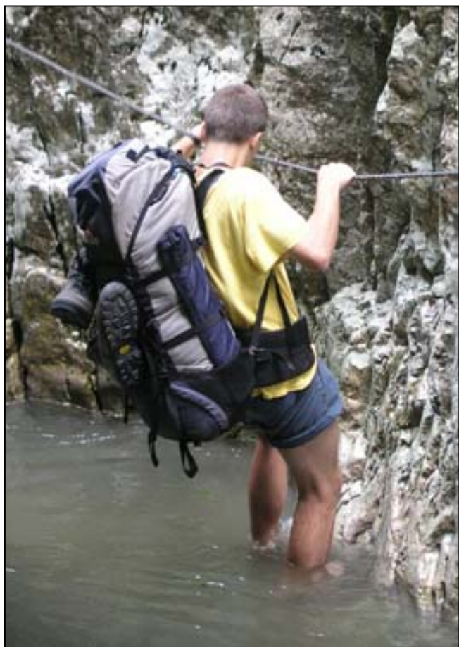
Cesta soutěskou – úroveň 2