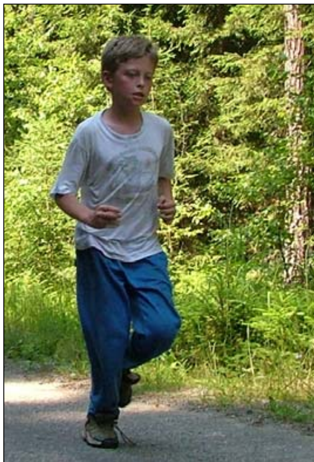
Olympijské hry - běh daleký

A jak bývá zvykem, každý si podle svého pořadí vybral písničku a něco z připravených odměn. Oheň se táhl dlouho do noci a i když většina dětí již dávno spala, stále jsme broukali stokrát ohrané písničky a nechtělo se nám jít do tábora a do spacáků a spát. Vždyť tady v těch širých hvozdech už