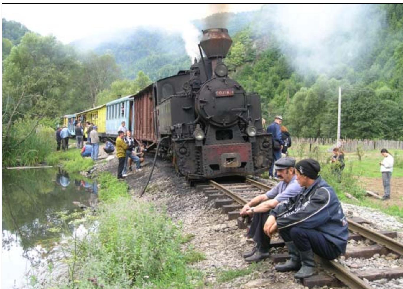
Jedna z četných přestávek při cestě nahoru údolím Vaseru - dobírání vody

Stihli jsme vyrazit již před polednem, vrátili jsme se na hřeben a pokračovali v cestě. Hranice vede střídavě po travnatých kopcích a zalesněnými sedly. Po poledni se opět strhává lehce emotivní spor o to, kde zastavíme na oběd. Nakonec zastavujeme v mraveništi a všichni jsou spokojeni. Překvapivě neprší, je celkem příjemné počasí. Po několika dalších kilometrech se již začínáme blížit ke kultovnímu místu a hlavnímu lákadlu této trasy, totiž špičatému vrchu Stoh, na kterém bylo předválečné trojmezí Rumunska, Polska a Československa. Ještě než tam dorazíme, potkáváme skupinu kamarádkých maďarských turistů, kteří nám věnovali výtisk publikace o Karpatech (kterou sami napsali). Bohužel je celá