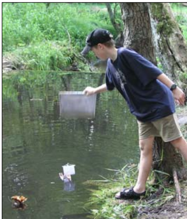
Soutěž v plachtění