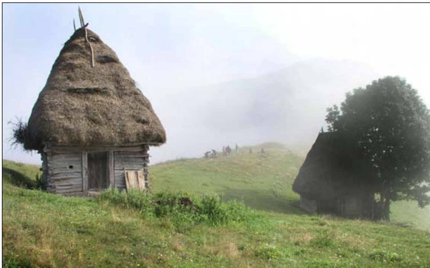
Hřebínek nad Huda lui Papară

kteře byly nedávno pečlivě zrekonstruované do původní podoby. Ani na druhém konci však nebylo po muzeu ani památky a nikdo o ničem takovém nevěděl. Začali jsme tedy pátrat v terénu, zkoumat, kde se mohla současná trasa odchýlit od původní, a půjčovali jsme si od turistů jiné mapy s nadějí, že tam snad bude muzeum zakresleno. Vše bezvýsledně. Ostatní už usoudili, že jsem si to celé asi vymyslel, a vydali jsme se alespoň k Dunaji podívat se na řetězový most a parlament. Na nábřeží jsem si od nějakých turistů půjčil průvodce a konečně jsem tam muzeum metra našel – je u stanice Deák F. tér, ovšem již mělo zavřeno. Alespoň to víme pro příště. Později, v Praze na nádraží, nás při pohledu na mapu MHD napadlo, jestli u nás náhodou není také nějaká utajená stanice metra se začarovaným muzeem, o kterém nikdo nic neví.