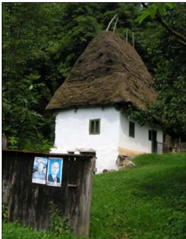
Typická trascăuská chaloupka . Volební agitace probíhá i zde.

lezli po strmé louce do vsi Brădești, začalo pršet. Ve vesnici jsme vyfotili bývalý Magazin Mixt, kde jsme v roce 1997 za noční bouřky a výpadku proudu jedli chleba s hořčicí. Povídal si s námi veselý fousatý pop, který tam přijel sloužit mši (byla neděle) a poté jsme vyrazili dál, údolím směrem k Huda lui Papară. Začalo lejt a tak jsme se drze schovali v chlívku u cesty, jen Ahalbert nejdřív zůstal stát v dešti a rozčileně povídal cosi o nekonzistentním uvažování, proč prý jsme nezůstali pod střechou ve vesnici. Byl dávno čas oběda, a tak jsme něco slupli. Déšť naštěstí netrval dlouho. Na další cestě procházíme několika vískami s pěknými chalupami, cesta se zmenšuje a pak zastavujeme na takové krasové louce, svítí slunce a máme válečí náladu. Aha si nalil vodu do přírodního umyvadla, aby si umyl ruce. Usoudili jsme, že je nevyšší čas převařit mléko, aby se nezkazilo, ale byla to jen záminka, proč zůstat na pěkném místě asi dvě hodiny. Po týdnu mokrého počasí se stále nemůžeme nabažit slunce. V podvečer pokračujeme ještě asi kilometr,