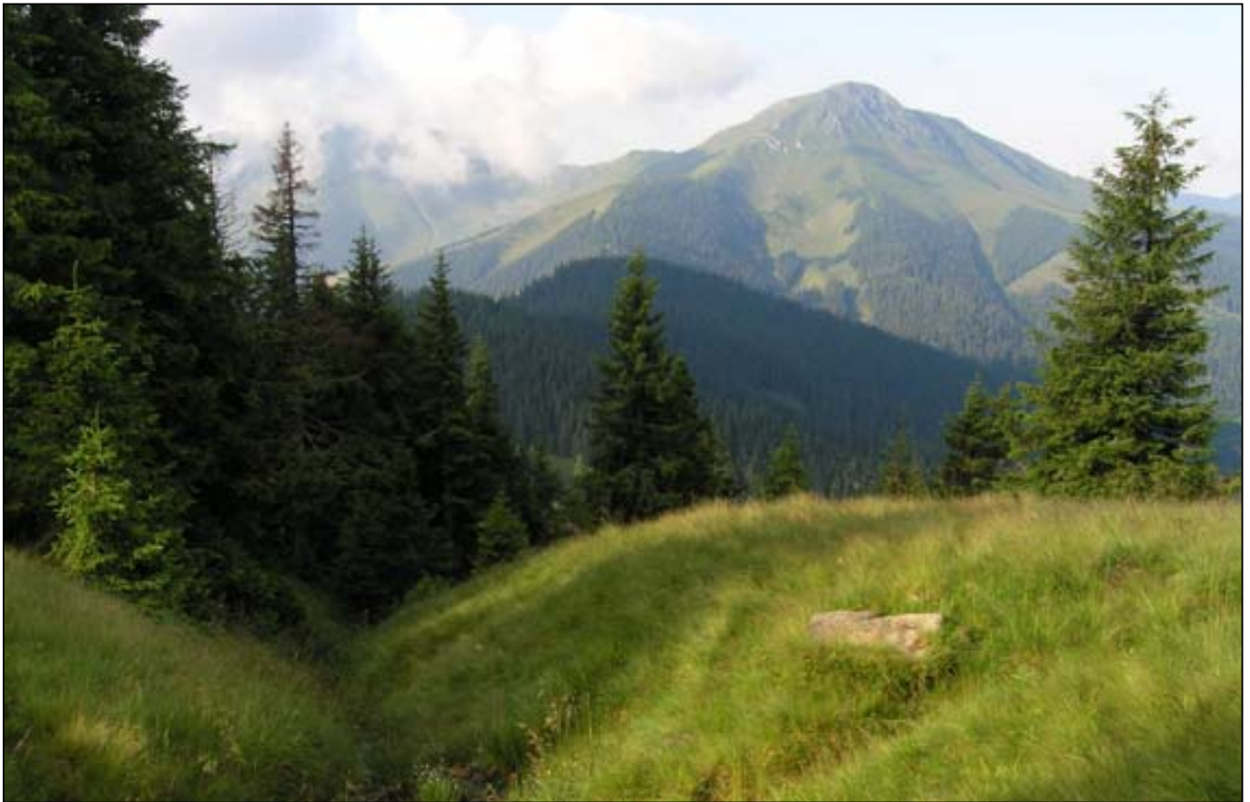
Pohled na Farcău z našeho tábořiště

vodou, což nás ujišťuje, že touto cestou již žádné povozy nejezdí. Při zastávce si Sova sedl na batoh a podívoval se, proč kolem něj lítá roj vos. Byl upozoněn, že nejspíš sedí ve vosím hnízdě, a při následném úprku naštěstí dostal jen jedno pigáro. Začalo mrholit, my jsme ztratili cestu a než jsme ji našli, museli jsme prolézt přes padlé klády a zarostlou paseku. Předhonil nás bača s asi třemi kluky, dvěma koni a psem, který mluvil ukrajinsky (ten bača) a povídal, že u nich nahore můžeme přespat. Posléze kopec zvolnil, les končí a dál stoupáme po loukách, přičemž se občas ocitneme v mraku. V úbočí pod smrky jsme se rozhodli poobědovat, zanedlouho však balíme protože je pěkná kosa a začíná mírně pršet. Stoupáme dál až k místu, kde cesta vede po vrstevnici svahem, nakonec jsme se ale rozhodli přelézt oblý kopec porostlý jalovci, protože jsme si nebyli jisti, jestli nechceme na jiný