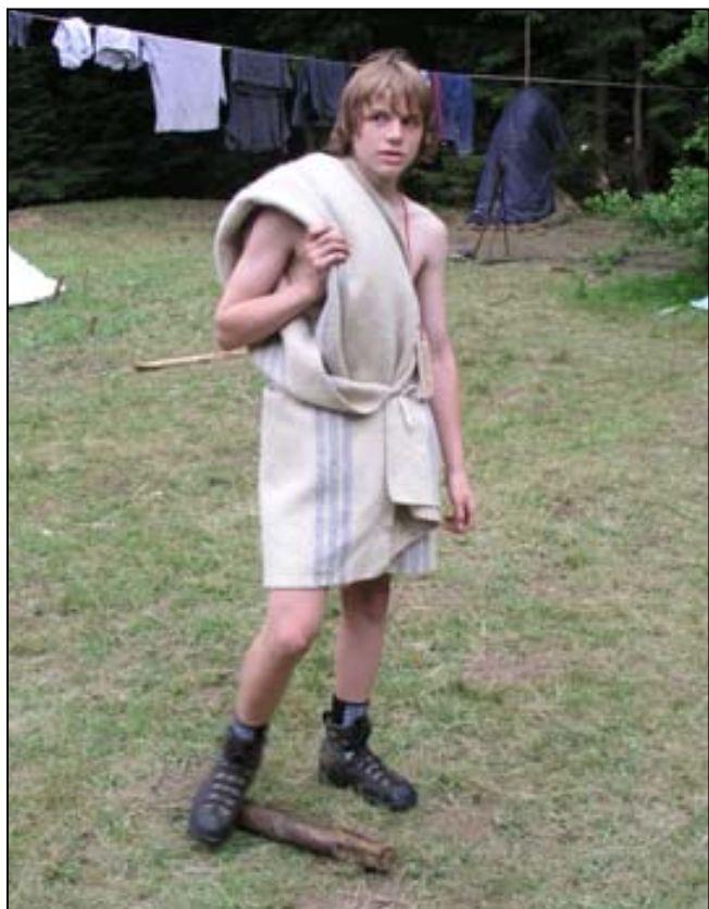
Kubula se vrací z „přežití“

doval. Přišlo na něj jakési blivno a tvářil se ospale a smutně. Ráno nás chladně přijaly vody Černé, kam jsem toho dne pustil už i Vavříka. V Soběnově mě jeden pán s rodinkou podezříval, že všichni čtyři Štíři jsou moji stateční synové. Tak jsem ho rychle