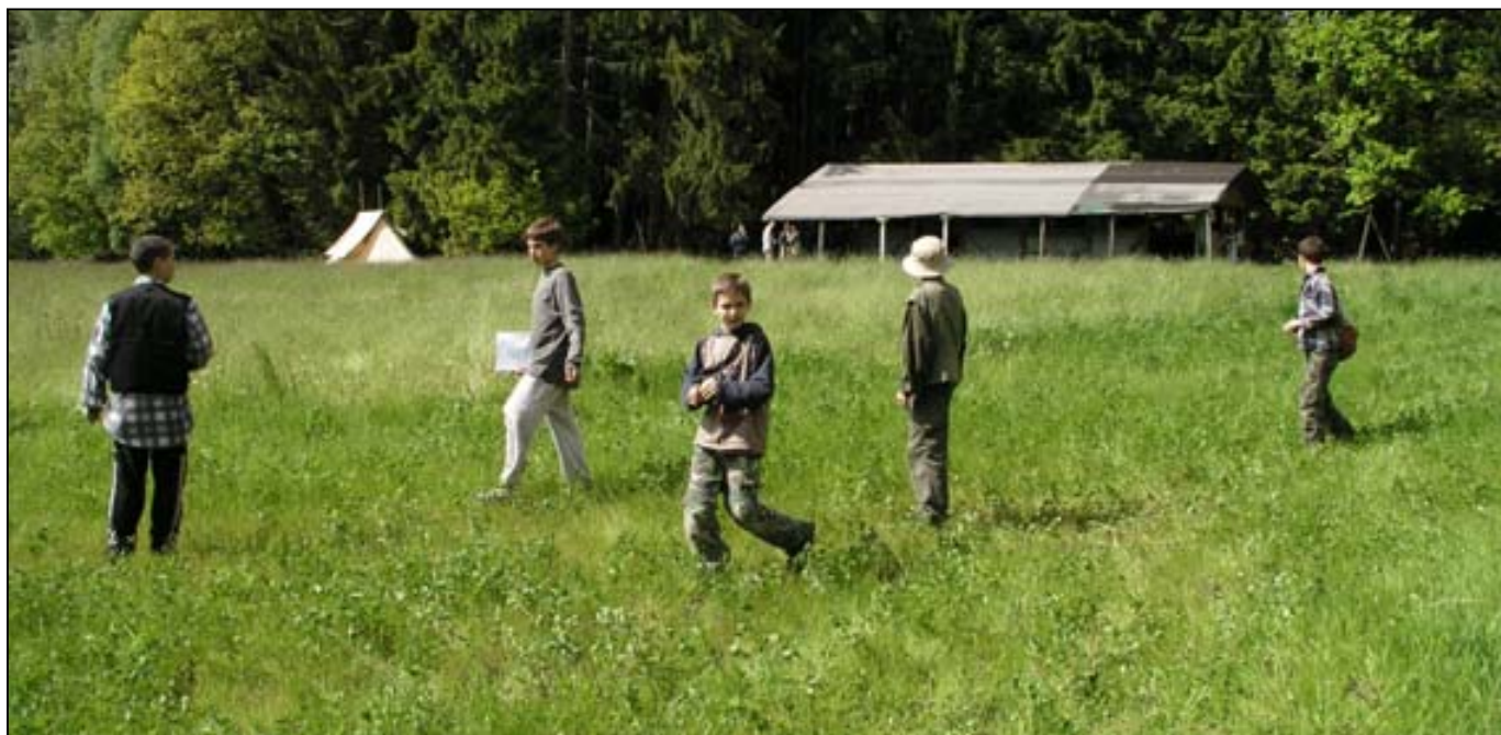
Týmům chvíli trvalo, než pochopily pravidla, ale pak už se mohlo začít hrát...

obdržel instrukce ke hře. Asi čtvrt hodiny jsme se rozhodovali jestli budeme a hrát, ale naštěstí jsme se rozhodli, že jo. Kontroly byly různě tvárné, například: ruka zlodějská, rozdělení ohně, vyměření vody podle dvou kotlů, kuličky atd. a k tomu jsme ještě museli sebrat různé znaky po lese. My jsme měli ještě usnadnění, a to, že jsme jezdili na kolech.