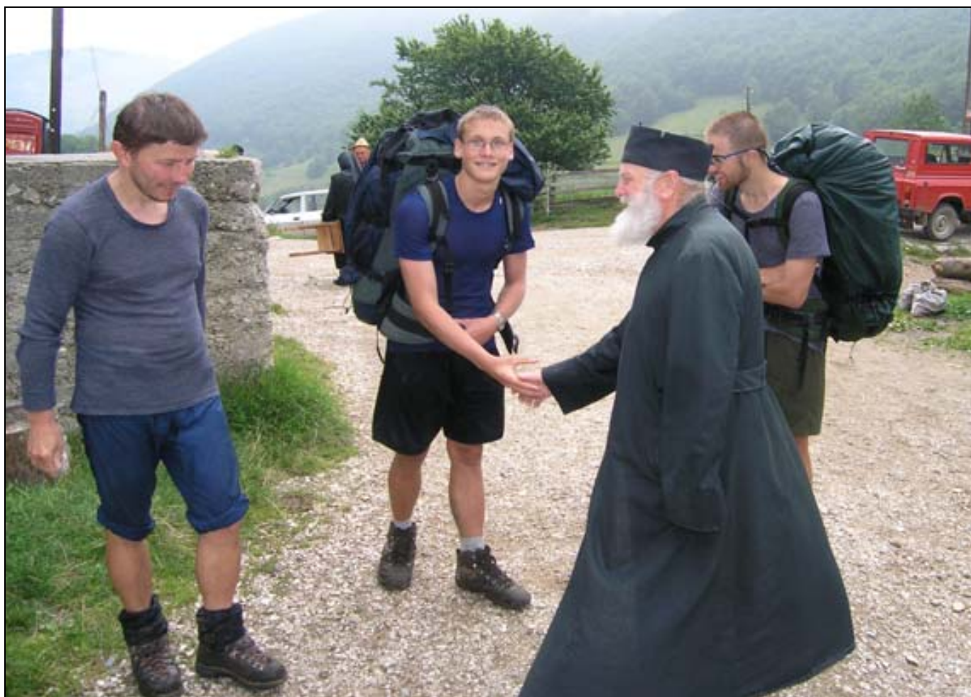
Naše přivítání v Brădești místním popem