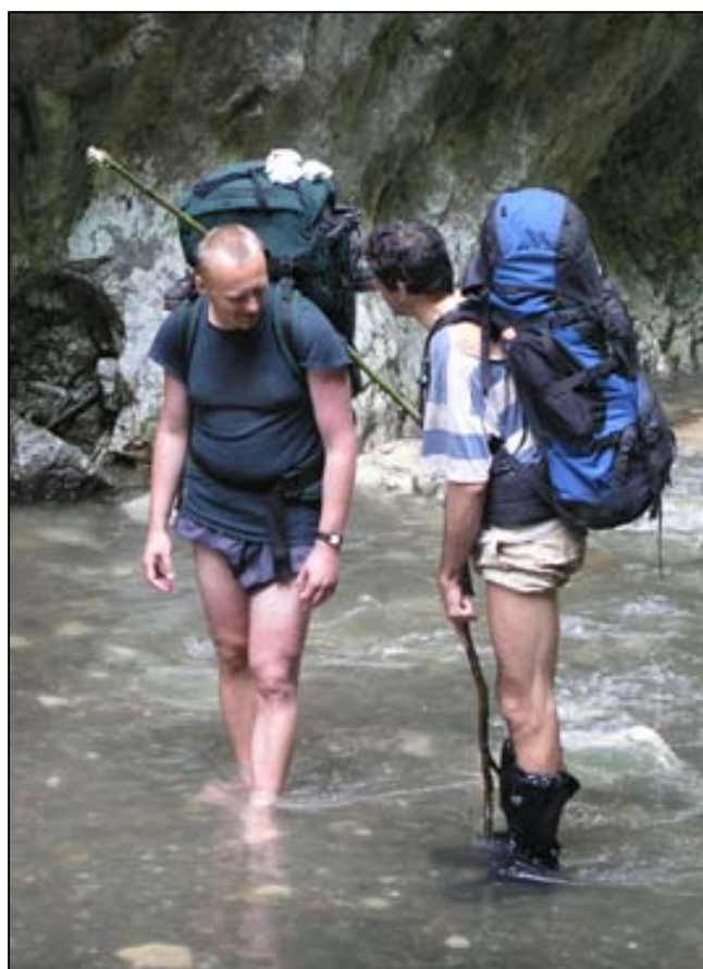
Cesta soutěskou – úroveň 1

až na hranu nad jeskyní, tam necháváme batohy a Ahalberta a po loukách scházíme do kotle, kde končí dvě údolí a potoky mizí v jeskyni Dilbina, aby se vynořily na druhé straně kopce z Huda Lui Papară. Kotel pod stometrovou svislou stěnou se prý při jarním tání zpola zaplní vodou. Jeden potok přitéká soustěskou, ve které tatík se synem zrovna chytají ryby na pruty z klacku, druhý padá z výše vodopádem a společně se ztrácejí v otvoru pod skalou, do kterého se Sova snaží mermomocí spadnout. Zjišťujeme, že monumentálnost toho místa na fotografii zachytit nelze, tak se alespoň ještě koupeme, nabíráme vodu, Sova zjišťuje, že ztratil hodinky, ale nemůže je nalézt a již za soumraku se vracíme zpět k batohům. Stavíme stany a druží se s námi sympatický dědýs z krásně uklizené minichaloupky, která stojí opodál. Přinesl nám misku jakýchsi podezřelých drobných hub, které nikdo z nás nezná, a s opovržením zahazuje Kulecí křemenáče. Když se tváříme rozpačitě, běží ještě pro kus slaniny, abychom to měli na čem smažit.