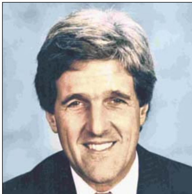
John Kerry, senátor Kongresu USA

„ŠUP jsem dříve moc nečetl, ale protože jsem kvůli tomu prohrál prezidentské volby, zajistil jsem si raději předplatné na následující 4 roky.“