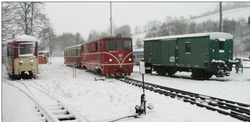
Úzkorozchodné mašinky a vagónky na nádraží v Třemešné

v Třemešné ve Slezsku a hned se jdeme podívat k úzkorozchodným vagónkům. Jsou zde ještě nějaké starší nákladní vagónky. Magyal nám vysvětluje, proč jsou potřeba. Na rozdíl od normálněrozchodných vagónů na úzkorozchodných podvalnicích jsou tyto vagónky brzděné, mašinka by jinak vlak sama neubrzdila. Zkoušíme fotit mašinky ze všech stran ( všude je krásný čerstvý sníh a stále sněží ). Rovněž se snažím s nepříliš dobrým výsledkem umýt čelní sklo zadního vagónku. Zpočátku jsme jediní cestující. Po příjezdu vlaku z Krnova se vagón docela zaplní. Tipujeme, který oblouk je ten nejmenší s poloměrem 75 metrů. Magyal promýšlí, jak by se v terénu zjišťoval střed kružnice procházející tímto obloukem. Další slíbenou atrakcí je výhybna pro jeden vagóněk. Projíždíme přes Amalín City a za chvíli naše cesta končí v Osoblaze. Zde opět důkladně fotíme depo a mašinky. Magyal vysvětluje, jak fungují samozacvakávací spoje vagónků a mašinek. Jdeme ještě na náměstí, kde mají jako monument dělo. Přemýšlíme proč jsou u hlavně ještě díry na stranu. Jinak je to značně hnusné město zpravené paneláky. Ještě fotím Treblahu v Osoblaze a honem zpátky na nádraží, aby nám to neujelo. Je