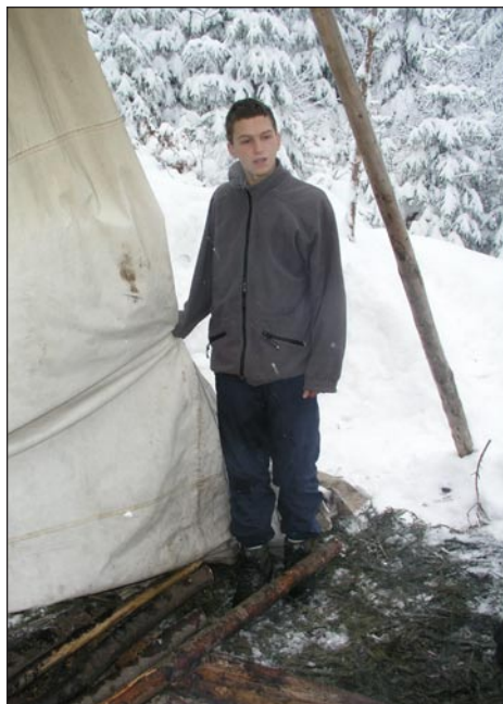
Odjíždíme a Aha je zatím zabrán do sušení plachty