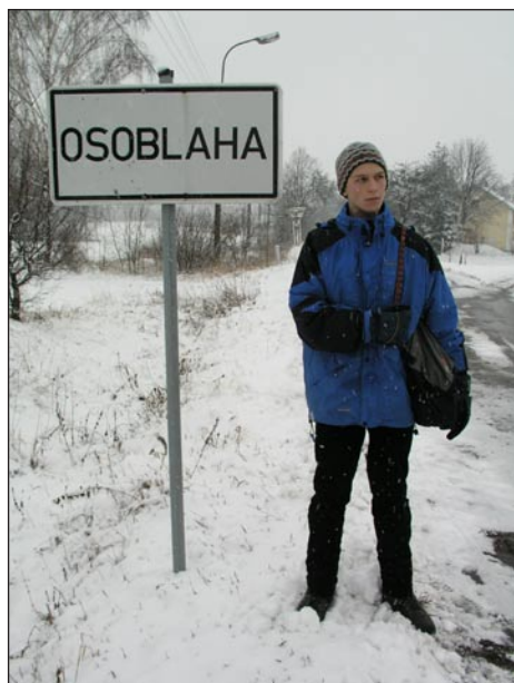
Treblaha v Osoblaze